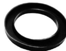
Código: 50068 Modelo: FIAT 600 Nº Original: 4010514 Asiento espiral de suspensión