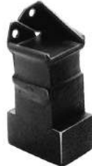
Código: 60042 Modelo: P. 504 - 505 Nº Original: 1874-032 Contrapeso de caja