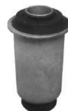
Código: 30012 Modelo: HILUX 4X2 Nº Original: 48654-35010 Buje parrilla inferior