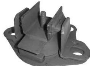
Código: 80147 HIDRAULICO Modelo: MEGANE 1.6 - CLIO FASE II Nº Original: 7700437391 Soporte de motor derecho (hidráulico)