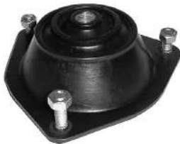
Código: 90006 Modelo: 1500 1.8 Nº Original: 4125054 Cazoleta sin rodamiento