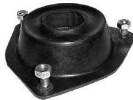
Código: 90007 Modelo: 1500 1.8 Nº Original: 712445535 Cazoleta con rodamiento