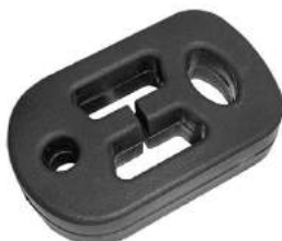
Código: 60071 Modelo: 206 Nº Original: 9620378080 Soporte caño de escape