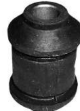
Código: 90033 Modelo: BORA - CADDY - GOLF - NEW BEETLE - PASSAT - POLO Nº Original: 307407182 Buje parrilla inferior delantera parte delantera