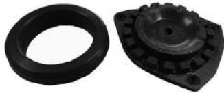
Código: 80195C Modelo: FLUENCE-MEGANE III Nº Original: 54320001R Soporte de amortiguador con crapodina