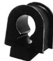
Código: 70030 Modelo: F. TAUNUS Nº Original: 71BB-3K573-AD Aislador caja de dirección