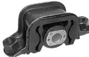
Código: 50119 Modelo: DUCATO Nº Original: B-184666 Soporte de caja (modelo nuevo)