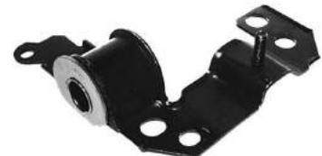
Código: 50173 Modelo: IDEA Nº Original: 51705472 Soporte parrilla delantero izquierda