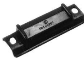
Código: 50042 Modelo: FIAT 128 Nº Original: 4121524 Taco de apoyo elástico trasero