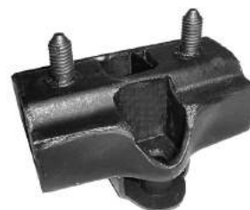
Código: 70125 Modelo: FALCON - 188 221 Nº Original: BAE20Z6068A Soporte de caja