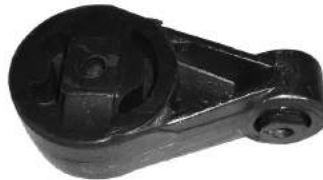
Código: 70149 Modelo: FOCUS Nº Original: 1061205 Soporte central de motor