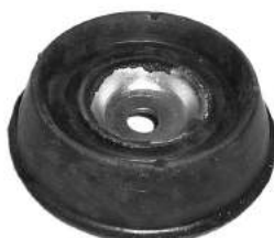
Código: 70136 Modelo: ESCORT Nº Original: 86-AU3K132-A Soporte de amortiguador