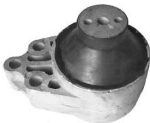
Código: 70167 NO HIDRAULICO Modelo: FIESTA - FOCUS - ECOSPORT Nº Original: 2N15-6F012-JB Soporte motor no hidráulico lado derecho