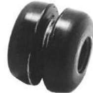
Código: 70001 Modelo: F. FALCON (62-82) Nº Original: C 6 DZ-34187-A Buje tensor