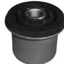
Código: 90036 Modelo: CARAT - QUANTUM Nº Original: 857407181 Buje parrilla inferior delantera