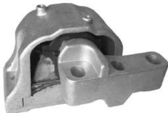
Código: 90046 HIDRAULICO Modelo: GOLF 1.8 - BORA - PASSAT - A3 Nº Original: 1J0.199.262.BF Soporte motor hidráulico lado derecho