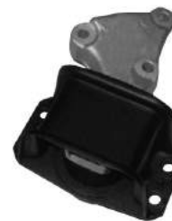
Código: 20009 HIDRAULICO Modelo: C4 2.0 HDI Nº Original: 1839.93 Soporte de motor hidráulico