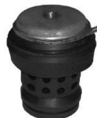
Código: 90021 Modelo: POLO - CADDY - Nafta / Diesel Nº Original: 1H0199609B Soporte de motor delantero central