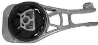
Código: 40084 Modelo: PRISMA - SPIN-ONIX-SONIC-COBALT Nº Original: 95493722 Soporte trasero de motor