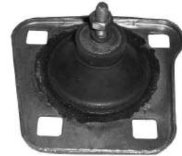
Código: 70146 NO HIDRAULICO Modelo: FIESTA Diesel Nº Original: 1021268 Soporte de motor delantero (no hidráulico)