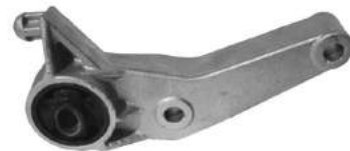
Código: 40058 Modelo: CORSA II - MERIVA Nº Original: 93302286 Soporte tensor superior