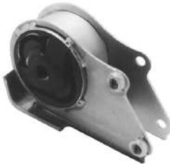
Código: 20028 Modelo: JUMPER Nº Original: 1843.98 Soporte de caja