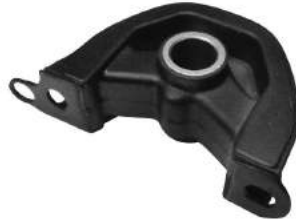
Código: 10002 Modelo: CIVIC CRV Nº Original: 50841-SR0-003 Soporte motor delantero lado derecho