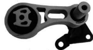
Código: 70225 Modelo: ECOSPORT KINECTIC 1.6 Nº Original: CV21-6P082-DA Soporte de motor trasero