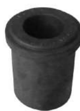
Código: 30011 Modelo: HILUX 4X2 - 4X4 SR5 Nº Original: 90385-18025 Buje elástico trasero 17 mm