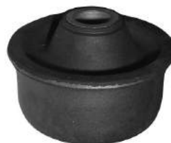
Código: 70154 Modelo: ESCORT - FIESTA - KA - ORION Nº Original: 547407181 Buje parrilla delantera parte trasera (punta pestaña)