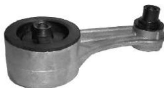
Código: 80131 Modelo: CLIO - 19 - EXPRESS Nº Original: 7700800522 Soporte de motor lado caja (recto 41 mm)