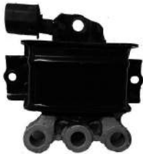
Código: 40089 Modelo: ONIX-SPIN-COBALT-PRISMA-SONIC Nº Original: 951644887 52068329 Soporte de motor derecho