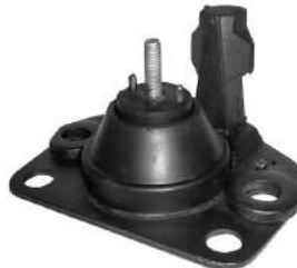
Código: 80137 HIDRAULICO Modelo: CLIO - EXPRESS Diesel Nº Original: 7700818994 Soporte de motor derecho (hidráulico)