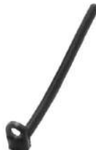
Código: 60034 Modelo: P. 504 - 404 Nº Original: 0127-050 Junta bancada