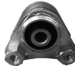
Código: 60098 Modelo: BOXER Nº Original: 1846-65 Soporte superior de motor