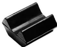
Código: 50008 Modelo: FIAT 600 Nº Original: 991591 Soporte de elástico delantero