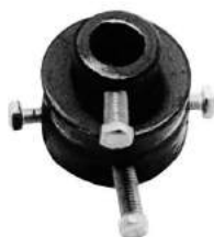
Código: 50021 Modelo: FIAT 600 Nº Original: 1472046 Acople elástico de palanca de cambios regulable