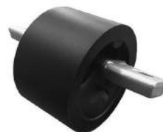
Código: 10021 Modelo: DODGE JOURNEY Nº Original: 04766474AC Buje reparación soporte motor izquierdo