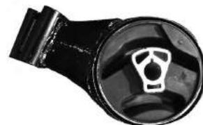
Código: 40094 Modelo: CRUZE Nº Original: 13248630 Soporte trasero de motor