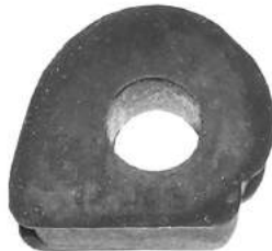
Código: 90029 Modelo: GACEL - GOL - SENDA - SAVEIRO Nº Original: 305411327-1 Buje barra estabilizadora centro Ø 15 mm