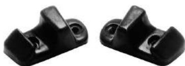
Código: 50003 D-I Modelo: FIAT 600 Nº Original: 965955-965956 Tope de respaldo de asiento trasero der./izq.