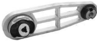
Código: 80205 Modelo: LOGAN-MEGANE-SANDERO-SCENIC-CLIO III Nº Original: 8200500928 Soporte de motor trasero central reforzado