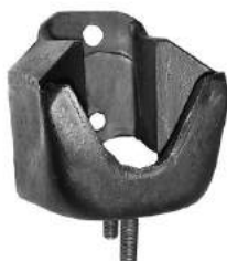
Código: 70101 Modelo: FALCON 4 Bancadas Nº Original: CODD6038F Soporte de motor delantero