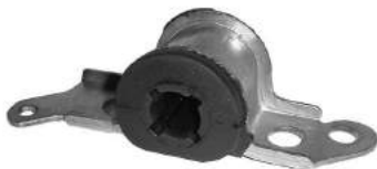
Código: 50146 Modelo: FIAT PALIO - SIENA (Base) Nº Original: 46450462 Soporte punta de parrilla derecho