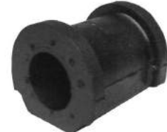
Código: 10006 Modelo: CIVIC 2001 en adelante Nº Original: Sin Código Buje barra estabilizadora delantero central ø 24 mm