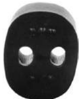
Código: 50102 Modelo: FIAT DUNA - UNO Nº Original: 7508963 Soporte de caño de escape