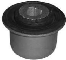
Código: 80165 Modelo: CLIO II - KANGOO Nº Original: 7700424399 Buje parrilla delantera Ø ext. 45 mm