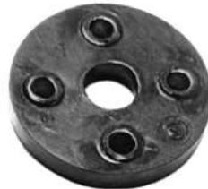
Código: 60021 Modelo: P. 404 - 504 - T4B Nº Original: 4040-060 Manchón acople de dirección