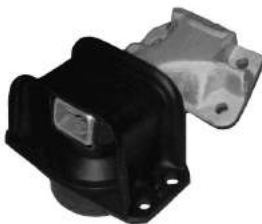
Código: 20010 HIDRAULICO Modelo: C4 1.6 Nafta Nº Original: 1839.92 Soporte de motor hidráulico