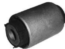
Código: 40036 Modelo: CHEVROLET VECTRA Nº Original: Buje parrilla inferior parte delantera (chico) Ø 35