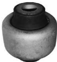
Código: 20013 Modelo: C4 Nº Original: 3523-910 Buje parrilla susp. delantera centro