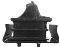
Código: 40091 Modelo: S10 2.8 MOTOR MWM Nº Original: 93285506 Soporte de motor ambos lados