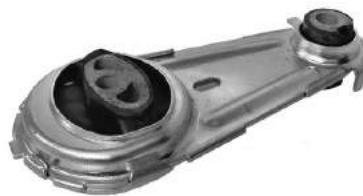
Código: 80191 Modelo: FLUENCE Nº Original: 112380010R Soporte de motor inferior