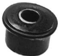
Código: 70025 Modelo: F. 100 Nº Original: C5T2-3B177-A Buje pivot eje delantero Ø 16 mm