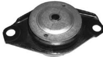
Código: 50170 Modelo: PALIO - SIENA 1.4 Nº Original: 51736531 Soporte de caja