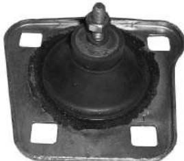
Código: 70177 HIDRAULICO Modelo: FIESTA Diesel Nº Original: 10.212.68 Soporte motor hidráulico delantero