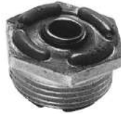
Código: 50128 Modelo: FIAT DUNA - UNO Nº Original: 7537167 Soporte de amortiguador trasero