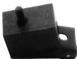
Código: 50033 Modelo: FIAT 600 Nº Original: 870286 Soporte de caja de velocidades