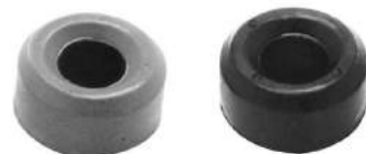
Código: 50018-50038 Modelo: FIAT 128 Nº Original: 4540587 Buje tensor - Buje tensor siliconado