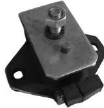
Código: 30002 Modelo: HILUX con motor 5 L Nº Original: 12361-54121 Soporte de motor