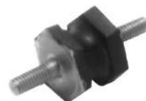
Código: 80101 Modelo: R. 4 - R. 6 - R. 12 Nº Original: 7702021650 Soporte caño de escape