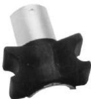
Código: 60054 Plateado Modelo: P. 405 Nº Original: 5094-340 Buje barra estabilizadora ø 22