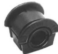
Código: 50135 Modelo: FIAT PALIO - SIENA Nº Original: 46465901 Buje barra estabilizadora ø 19 mm