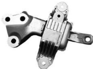
Código: 40092 Modelo: CRUZE Nº Original: 13248549 Soporte de transmision lado izq. caja autom.