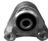
Código: 20033 Modelo: JUMPER Nº Original: 1846-65 Soporte superior de motor