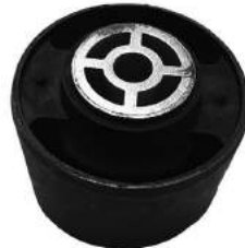
Código: 60097 Modelo: 206-207-307-407 Nº Original: 1807-47 Buje soporte de motor central D.65 MM