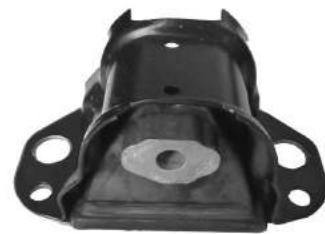
Código: 80171 NO HIDRAULICO Modelo: CLIO 1.2 - KANGOO Nº Original: 7700415087 Soporte motor no hidráulico lado derecho