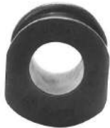
Código: 50124 Modelo: FIAT DUNA - UNO Nº Original: 4179802 Aislador de caja de dirección