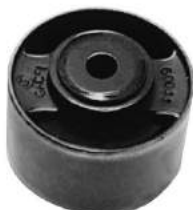
Código: 20023 Modelo: XSARA - XANTIA - BERLINGO Nº Original: 1809-160 buje central de motor