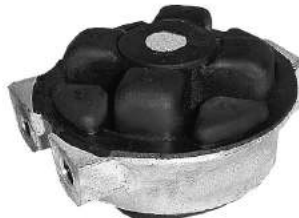
Código: 70124 Modelo: GALAXY Nº Original: 811399151B Soporte de caja