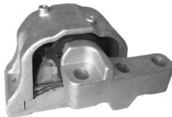
Código: 90047 NO HIDRAULICO Modelo: GOLF 1.8 - BORA - PASSAT - A3 Nº Original: 1J0.199.262.BF Soporte motor no hidráulico lado derecho