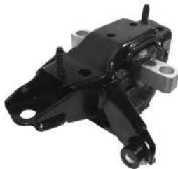
Código: 90060 Modelo: FOX - SURAN - VOYAGE - GOL TREND Nº Original: 6Q0.199.555.AD Soporte motor lado izquierdo