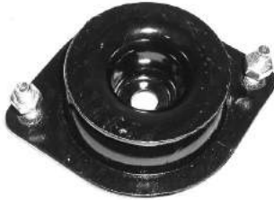
Código: 80153 Modelo: CLIO Nº Original: 7700795689 Soporte de motor superior