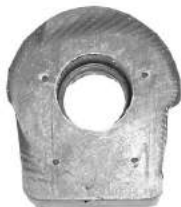
Código: 90034 Modelo: CARAT - PASSAT Nº Original: 305411313-2 Buje barra estabilizadora punta Ø 18 mm