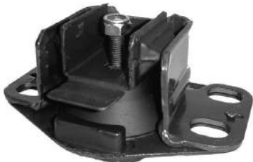
Código: 80145 HIDRAULICO Modelo: KANGOO Nº Original: 7700434320 Soporte de motor derecho (hidráulico)