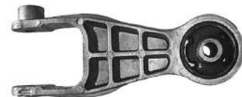
Código: 40061 Modelo: CORSA II - MERIVA Nº Original: 93302287 Soporte tensor inferior