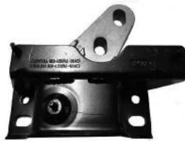
Código: 70224 Modelo: ECOSPORT KINECTIC 2.0 O 4X2 Nº Original: CN15-7M121-CB Soporte de motor izquierdo