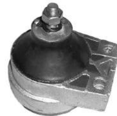
Código: 70165 HIDRAULICO Modelo: FOCUS Nº Original: 10.725.72/11.024.56 Soporte motor hidráulico lado derecho