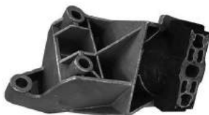
Código: 80200 Modelo: TWINGO Nº Original: 7700412094 Soporte de motor derecho