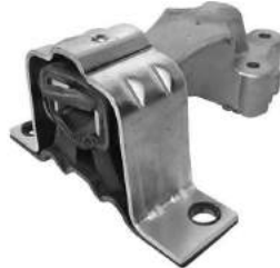
Código: 80189 Modelo: LOGAN - SANDERO Nº Original: 6001550551 Soporte motor derecho brazo aluminio