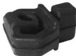
Código: 80185 Modelo: R19 Nº Original: 7700785798 Soporte caño de escape