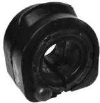
Código: 70198 Modelo: FOCUS Nº Original: 98AG-4A037-BA Buje barra trasera