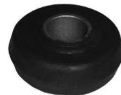
Código: 70152 Modelo: ESCORT Nº Original: 81AB-5K897-BA Buje tensor delantero y trasero