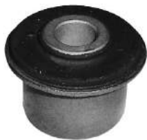
Código: 60084 Modelo: 306 - PARTNER Nº Original: 3523-401 Buje parrilla suspensión delantera (c/pestaña)