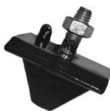
Código: 60077 Modelo: PEUGEOT 405 Nº Original: 1844170 Tope de motor lado derecho