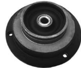
Código: 60065 Modelo: 505 82/86 Nº Original: 5210-170 Soporte de amortiguador