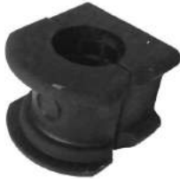
Código: 70184 Modelo: RANGER Nº Original: F87-5484-CG Buje barra estabilizadora Ø 33 mm