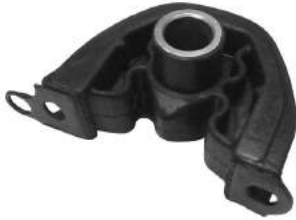
Código: 10001 Modelo: CIVIC CRV Nº Original: 50842-SR0-003 Soporte motor delantero lado izquierdo