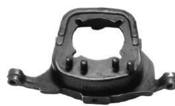
Código: 60037 Modelo: P. 505 - 504 5 Vel. Naftero Nº Original: 1843701 Soporte de caja de velocidad