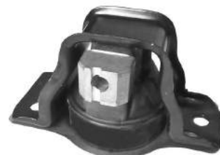
Código: 80176 HIDRAULICO Modelo: MEGANE II Nº Original: 8200549046 Soporte motor derecho hidráulico muela izq. Megane II