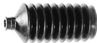
Código: 50079 Modelo: FIAT 128 - 147 - DUNA - UNO Nº Original: 4198250 Fuelle de caja de dirección corto