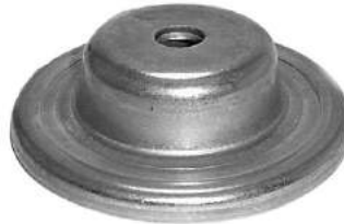
Código: 80134 Modelo: EXPRESS Nº Original: 7700308789 Cazoleta delantera (solo chapa)