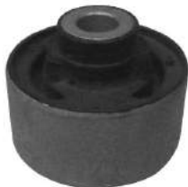
Código: 10007 Modelo: CIVIC 2001 - 2003 Nº Original: 51391-S5A-801 Buje parrilla inferior