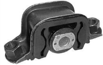
Código: 20027 Modelo: JUMPER Nº Original: 1308696080 Soporte de caja m/n