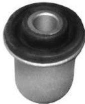
Código: 80193 Modelo: LOGAN - SANDERO Nº Original: 8200806340 Buje parrilla susp. delantera