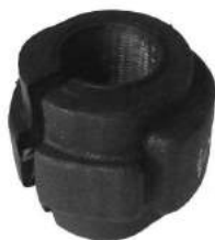
Código: 90064 Modelo: PASSAT 2002 en adelante Nº Original: 4D0.411.327-E Buje barra estabilizadora ø 24 mm