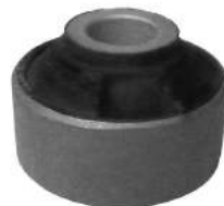
Código: 10011 Modelo: FIT Nº Original: 51391 Buje parrilla suspensión del. Parte posterior