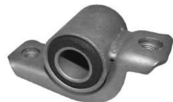
Código: 50176 Modelo: BRAVO - BRAVA - TIPO Nº Original: 7601064 Buje brazo suspensión ø 20 mm