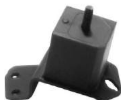
Código: 80103 Modelo: R. 18 2000 - FUEGO Nº Original: 7704000769 Soporte de motor izquierdo