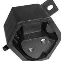
Código: 70120 Modelo: ESCORT Nº Original: 86AU6B032C Soporte de motor delantero