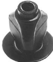
Código: 70019 Modelo: F. TAUNUS Nº Original: 74BR-5L021-D Buje aislador trasero