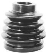
Código: 50107 Modelo: FIAT DUNA - UNO Nº Original: Fuelle de palier