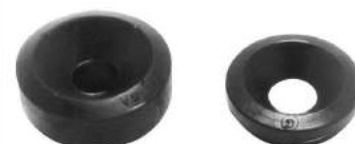
Código: 50024-50025 Modelo: FIAT 600 Nº Original: 878165-878166 Soporte de motor trasero (juego)