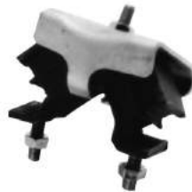
Código: 80121 Modelo: R. 19 - CLIO Nº Original: 770078949 Soporte de motor derecho