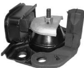
Código: 80142 NO HIDRAULICO Modelo: CLIO - EXPRESS Diesel Nº Original: 7700805123 Soporte de motor (no hidráulico)