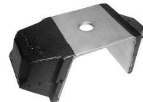
Código: 60062 Modelo: 405 Nº Original: 1844-170 Tope soporte de motor