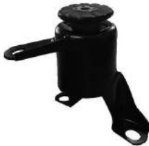
Código: 70218 HIDRAULICO Modelo: ECOSPORT KINECTIC Nº Original: CN15-6F012-DC Soporte de motor derecho hidraulico