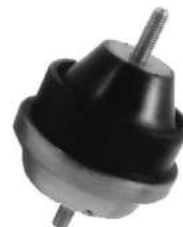
Código: 20018 HIDRAULICO Modelo: BERLINGO Nº Original: 1844.47 Soporte de motor hidráulico