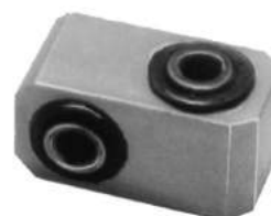
Código: 80035 Modelo: R. 12 Nº Original: 7700525716 Unión cardánica de dirección