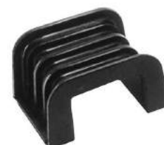
Código: 50046 Modelo: FIAT 600 Nº Original: 4196807 Apoyo soporte de radiador