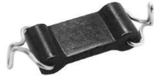
Código: 50066 Modelo: FIAT 125 Nº Original: 424979 Sostén caño de escape