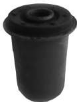
Código: 70181 Modelo: RANGER Nº Original: F57A-3A262-CA Buje parrilla del. inferior parte trasera