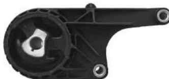
Código: 40093 Modelo: CRUZE Nº Original: 13248605 Soporte de transmision lado izq. caja manual