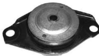
Código: 50159 Modelo: PALIO 1.8 Nº Original: 0051715728 Soporte de caja de velocidades