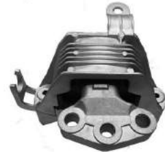
Código: 40086 HIDRAULICO Modelo: CRUZE Nº Original: 13347455 13248475 Soporte de motor derecho