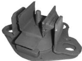
Código: 80148 NO HIDRAULICO Modelo: MEGANE 1.6 - CLIO FASE II Nº Original: 7700437391 Soporte de motor derecho (no hidráulico)