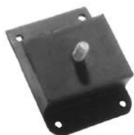
Código: 80112 Modelo: R. 4 - R. 6 Nº Original: 1018840 Repuesto para soporte de motor