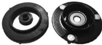
Código: 40090 Modelo: S10 Nº Original: 94708478 Soporte de amortiguador