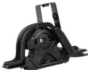
Código: 50167 Modelo: DOBLO Nº Original: 46842706 Soporte de motor delantero