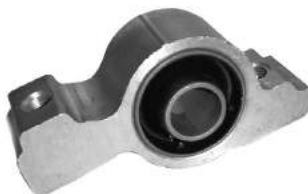
Código: 60066 Modelo: 406 Nº Original: 3523-610 S/block parrilla delantera