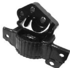
Código: 50181 Modelo: PUNTO 1.4 Nº Original: 51761601 Soporte motor lado derecho