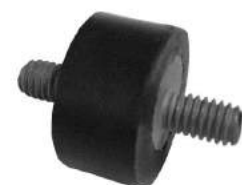
Código: 90012 Modelo: GOL - GACEL - SAVERIO - SENDA Nº Original: OZBA121273 Soporte de radiador (grande)