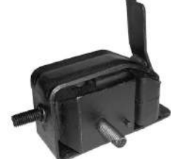
Código: 70118 Modelo: ESCORT Nº Original: 86AU6038AA Soporte de motor trasero derecho