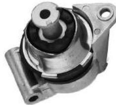
Código: 40085 Modelo: ASTRA - ZAFIRA Nº Original: 90538582 Soporte trasero de motor