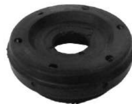
Código: 40071 Modelo: AVEO Nº Original: 96653239 Soporte de amortiguador