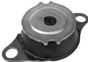
Código: 50152 Modelo: PALIO - SIENA 2001 en adelante Nº Original: 46520124 Soporte de motor