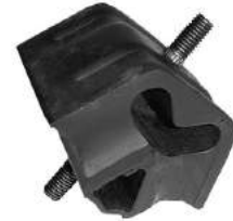
Código: 90005 Modelo: GOL - GACEL - SAVERIO - SENDA Nº Original: 823199381 Soporte de motor