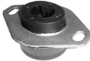
Código: 60067 Modelo: 405 - 205 Nº Original: 184395 Soporte de motor izquierdo