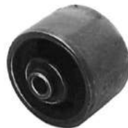
Código: 50005 Modelo: FIAT 128 Nº Original: 4218081 Buje de soporte de motor