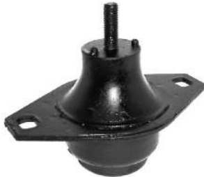
Código: 80133 NO HIDRAULICO Modelo: 19 Diesel Nº Original: 7700802927 Soporte de motor delant. derecho (no hidráulico)