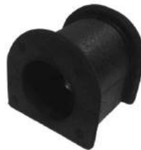
Código: 30005 Modelo: HILUX 4X4 SR5 Nº Original: 48815-14160 Buje barra estabilizadora