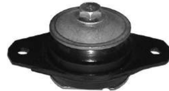
Código: 50154 Modelo: UNO - PALIO - SIENA MOTOR FIRE Nº Original: 51736529 Soporte de motor superior derecho