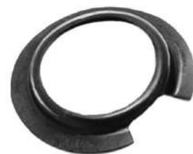
Código: 70035 Modelo: F. FALCON Nº Original: Base apoyo espiral