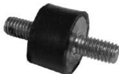
Código: 90013 Modelo: GOL - GACEL - SAVERIO - SENDA Nº Original: ZBA121275 Soporte de radiador (chico)