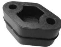
Código: 20029 Modelo: BERLINGO - JUMPER Nº Original: Sin Código Soporte caño escape