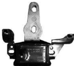
Código: 70228 Modelo: FIESTA KINECTIC 2013.. Nº Original: 8V51-7M121-AE Soporte de motor izquierdo lado caja