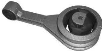
Código: 70144 Modelo: FIESTA Nº Original: XS61-6P082-AA Soporte de motor central