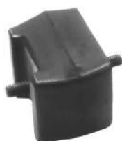
Código: 80033 Modelo: R. 12 Nº Original: 7700506311 Soporte trasero de motor