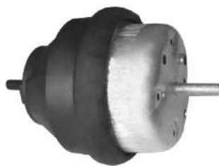
Código: 90040 HIDRAULICO Modelo: PASSAT - A4 Nº Original: 8D0.199.382.L Soporte motor hidráulico ambos lados