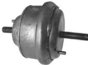
Código: 70175 NO HIDRAULICO Modelo: RANGER Nº Original: F47Z-6038-A Soporte motor no hidráulico