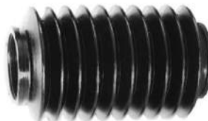
Código: 60017 Modelo: P. 504 - 505 Nº Original: 4066-170 Fuelle de caja de dirección