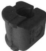
Código: 90055 Modelo: POLO - GOLF Nº Original: 1H0.411.314 Buje barra estabilizadora central ø 16 mm