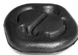
Código: 90011 Modelo: GACEL Nº Original: 817253147 Soporte caño de escape