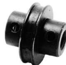
Código: 50020 Modelo: FIAT 600 Nº Original: 875546 Acople elástico de palanca de cambios