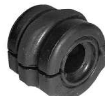
Código: 20021 Modelo: BERLINGO Nº Original: 5094-790 Soporte barra est. ø 20 mm