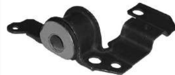
Código: 50157 Modelo: PALIO - SIENA FIRE Nº Original: 467485790 Soporte punta parrilla izquierdo