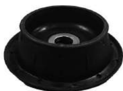
Código: 90071 Modelo: GOL FASE 3 01... Nº Original: 5X0.412.329 Soporte de amortiguador