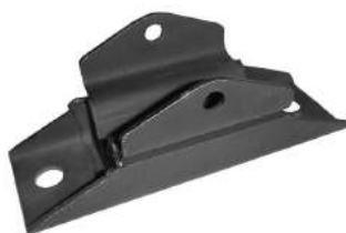
Código: 70111 Modelo: F100 Nº Original: BAC6TZ6068A Soporte de caja