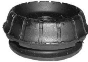
Código: 80154 Modelo: CLIO Nº Original: 7700827818 Cazoleta amortiguador delantero