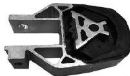
Código: 70219 Modelo: FOCUS II Nº Original: AV61-6P082-AB Soporte limitador de torsion