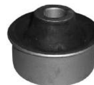
Código: 20012 Modelo: C4 Nº Original: 3523-770 Buje parrilla susp. delantera