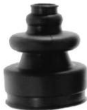
Código: 60048 Modelo: P. 405 Nº Original: 3287-790 Fuelle homocinética lado caja