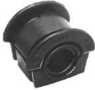
Código: 50136 Modelo: FIAT PALIO - SIENA Nº Original: 46465901 Buje barra estabilizadora ø 20 mm