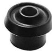
Código: 60033 Modelo: P. 505 Nº Original: 3523-090 Buje tensor