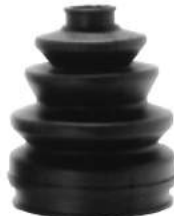
Código: 60049 Modelo: P. 405 Nº Original: 3293-830 Fuelle homocinética lado rueda