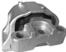
Código: 90044 HIDRAULICO Modelo: GOLF - 1.6 BORA - NEW BEETLE Nº Original: 1J0.199.262.BE Soporte motor hidráulico lado derecho