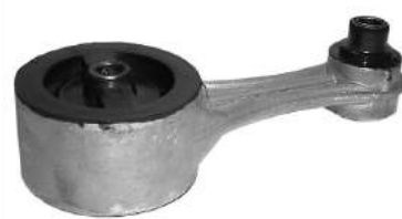
Código: 80129 Modelo: EXPRESS - CLIO Diesel Nº Original: 7700800522 Soporte de motor lado caja (recto 41 mm)