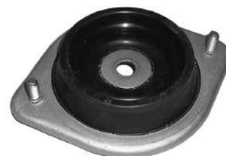
Código: 70173 Modelo: ORION Nº Original: 547112325 Soporte amortiguador