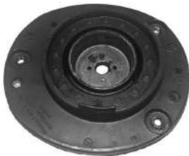
Código: 60096 I Y D Modelo: 207-206 M/N Nº Original: 5038-C5 5038-C6 Soporte amortiguador