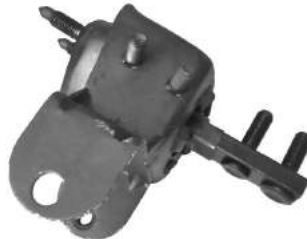
Código: 70169 NO HIDRAULICO Modelo: ESCORT Nafta Nº Original: 95AB-6038-EF Soporte motor lateral no hidráulico