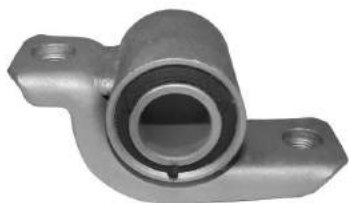
Código: 50177 Modelo: BRAVO - BRAVA - TIPO Nº Original: 46423823 Buje brazo suspensión ø 21 mm