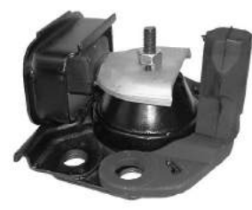
Código: 80141 HIDRAULICO Modelo: CLIO - EXPRESS Diesel Nº Original: 7700805123 Soporte de motor (hidráulico)