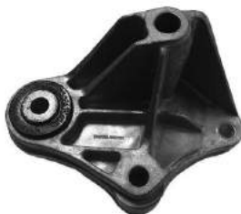
Código: 70221 Modelo: FOCUS II/III 1.6 Nº Original: 3M51-16P093-DC Soporte de caja de velocidades