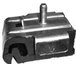
Código: 70038 Modelo: FIESTA Nafta - Diesel Nº Original: 6203710 Soporte de Motor derecho