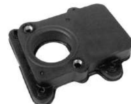
Código: 50151 Modelo: DUNA - UNO 1.4 Nº Original: 46593576 Aislante base carburador