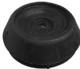
Código: 40048 Modelo: CORSA II - MERIVA Nº Original: 90538936 Soporte amortiguador