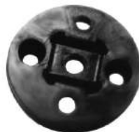
Código: 60052 Modelo: P. 504 - 505 Nº Original: 4040-081 Manchón de dirección reforzado