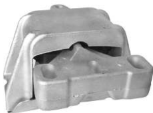
Código: 90049 Modelo: BORA - A3 Nº Original: 1J0.199.555.AJ Soporte motor lado izquierdo