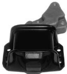
Código: 60074 HIDRAULICO Modelo: 307 - 2.0 Nafta Nº Original: 183994 Soporte de motor (hidráulico)