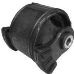
Código: 10010 Modelo: FIT Nº Original: 50805-SAA-013/SLN-A01 Buje reparación soporte motor lado izq. manual