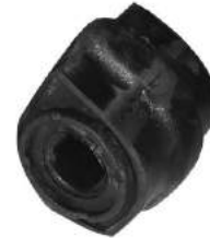
Código: 60092 Modelo: 206 Nafta Nº Original: 5094-810 Buje barra estabilizadora ø 17 mm