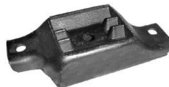
Código: 70103 Modelo: FALCON 1962-80 Nº Original: CIDZ6068A Soporte de caja