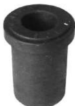
Código: 30010 Modelo: HILUX 4X2 - 4X4 SR5 Nº Original: 90385-15016 Buje elástico trasero 15 mm