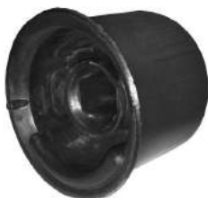
Código: 90037 Modelo: FOX - SPACE FOX - SURAN Nº Original: 6Q0.407.183.A Buje parrilla delantera parte trasera (plástico)