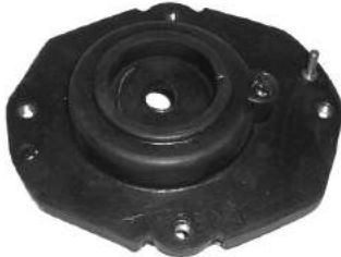
Código: 60079 Modelo: PEUGEOT 306 - PARTNER Nº Original: 5038-210-0 Cazoleta de amortiguador