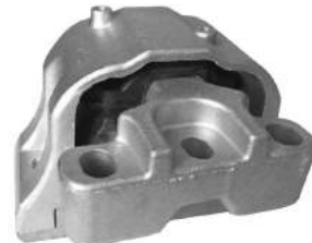
Código: 90045 NO HIDRAULICO Modelo: GOLF 1.6 - BORA - NEW BEETLE Nº Original: 1J0.199.262.BE Soporte motor no hidráulico lado derecho