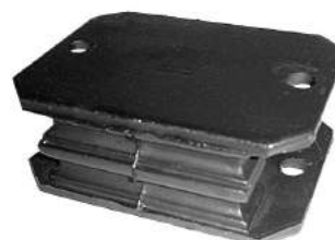
Código: 70113 Modelo: F100 - F600 - F700 Nº Original: BAC7D56038A Soporte de motor delantero