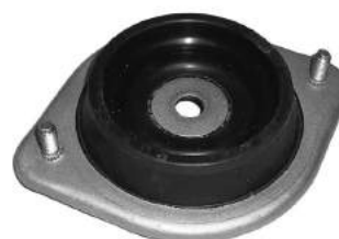
Código: 90024 Modelo: POINTER Nº Original: 547412325 Soporte de amortiguador