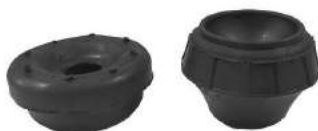
Código: 90073 Modelo: GOL AB9 Nº Original: 321.512.333 Y 321.512.335 Soporte amortiguador trasero completo