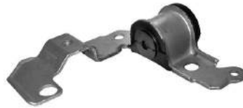
Código: 50142 Modelo: FIAT PALIO - SIENA (Full) Nº Original: 46454078 Soporte punta de parrilla derecho