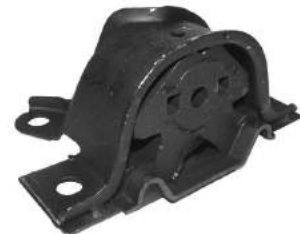
Código: 50168 Modelo: IDEA Nº Original: 51744579 Soporte de motor delantero