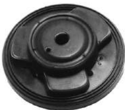
Código: 60018 Modelo: P. 504 Nº Original: 5210-133 Soporte de amortiguador delantero