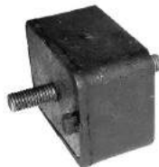
Código: 70036 Modelo: FIESTA Nº Original: 6194624 Soporte de motor naftero