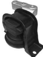
Código: 20005 HIDRAULICO Modelo: C3 Diesel Nº Original: 1807.W6 Soporte de motor hidráulico lado derecho