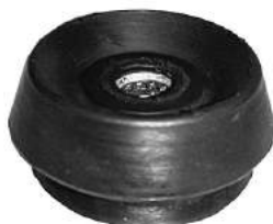
Código: 90010 Modelo: GOL - GACEL - SAVERIO - SENDA Nº Original: ZBA412353 Soporte de amortiguador