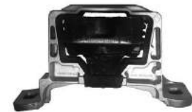
Código: 70216 HIDRAULICO Modelo: FOCUS II SIGMA 1.6 09.. Nº Original: 3M51-6F012-CJ Soporte de motor derecho hidraulico