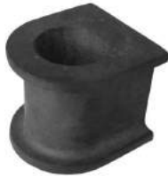
Código: 30013 Modelo: HILUX 4X2 Nº Original: 48815-30050 Buje barra estabilizadora delantera