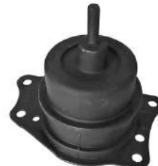
Código: 90043 NO HIDRAULICO Modelo: FOX - SURAN 1,6 Nº Original: 6Q0.199.167.J Soporte motor no hidráulico izquierdo