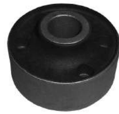
Código: 90030 Modelo: CADDY - GOLF - PASSAT - POLO Nº Original: 191407181-D Buje parrilla inferior delantera parte trasera Ø 17 mm