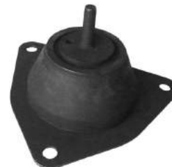
Código: 80173 NO HIDRAULICO Modelo: LAGUNA Nº Original: 7700414099 Soporte motor no hidráulico lado derecho