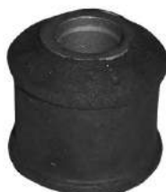
Código: 90026 Modelo: GOL - SAVEIRO - SENDA - GOLF - CARAT Nº Original: 305419809/1 Buje punta barra de dirección