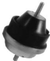
Código: 60051 HIDRAULICO Modelo: P. 206 - 306 - 406 Nº Original: 1844-470 Soporte de motor hidráulico