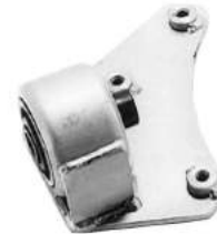
Código: 50112 Modelo: FIAT 147 - FIORINO Nº Original: 1481625 Soporte de motor lado derecho