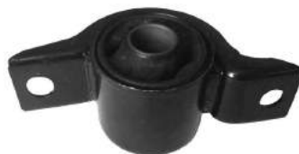
Código: 70196 Modelo: FOCUS Nº Original: 98AG-3A262-AG Buje soporte parrilla pico de pato