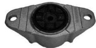
Código: 70220 Modelo: FOCUS II/III Nº Original: 3M51-18A11-AB Soporte amortiguador trasero