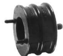
Código: 50009 Modelo: FIAT 1500 Nº Original: 4066936 Soporte delantero de motor