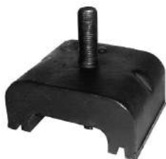
Código: 90016 Modelo: D100 - D400 - D500 Nº Original: 2230368 Soporte de caja