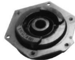
Código: 60050 Modelo: P. 505 Nº Original: 5210-220 Soporte de amortiguador (86/adelante)