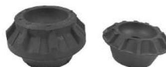
Código: 90074 Modelo: GOLF 90/98 - POLO 95/00 Nº Original: 191.512.333 Y 191.512.335 Soporte amortiguador trasero completo