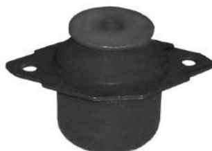
Código: 90023 HIDRAULICO Modelo: POLO - CADDY - Nafta / Diesel Nº Original: 3571199402B Soporte de caja (hidráulico)