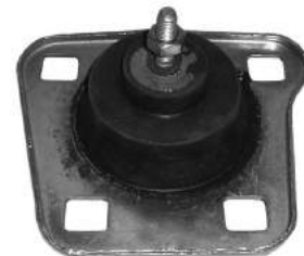
Código: 70178 HIDRAULICO Modelo: FIESTA Nafta Nº Original: 10.241.23/10.604.01 Soporte motor hidráulico delantero