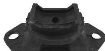
Código: 80198 Modelo: LOGAN-SANDERO Nº Original: 6001548160 Soporte de motor izquierdo