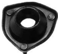
Código: 50017 Modelo: FIAT 128 Nº Original: 4226906 Soporte de amortiguador