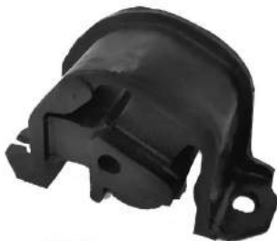
Código: 40070 Modelo: CORSA - AGILE Nº Original: 90538063 Soporte de motor izquierdo