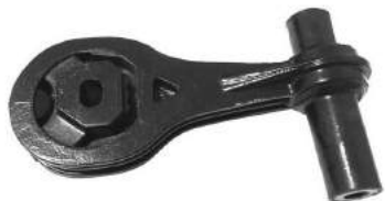
Código: 50180 Modelo: PUNTO 1.4 Nº Original: 51765196 Soporte tensor de motor