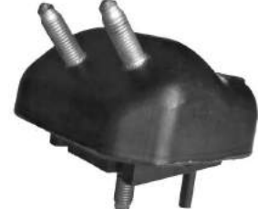
Código: 70179 Modelo: RANGER Diesel Nº Original: 787R-6038-A Soporte de motor izquierdo