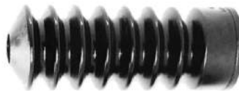
Código: 60014 Modelo: P. 504 - 404 Nº Original: 5424-030 Fuelle de amortiguador