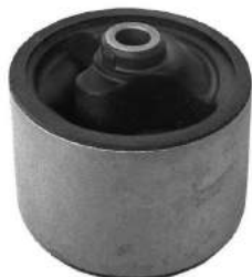
Código: 10016 Modelo: CIVIC Nº Original: 50820-SR3-J11 Buje reparación soporte izquierdo