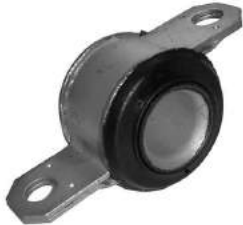
Código: 20025 Modelo: JUMPER Nº Original: 3521-650T Buje parrilla delantera c/chapa