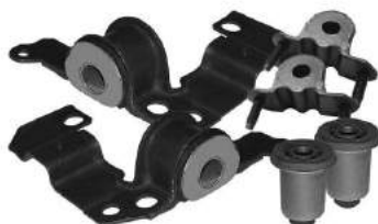
Código: 50186 Modelo: PALIO FIRE - SIENA FIRE Juego bujes dirección hidráulica (6 piezas)