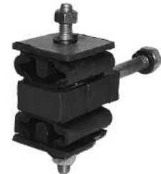
Código: 80161 Modelo: EXPRESS Diesel Nº Original: 7700770307 Soporte trasero de motor