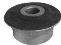
Código: 10012 Modelo: FIT Nº Original: 51392 Buje parrilla suspensión del. parte anterior