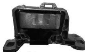
Código: 70222 HIDRAULICO Modelo: FOCUS II/III 2.0 DURATEC Nº Original: 3M51-6F012-AG Soporte de motor derecho hidraulico