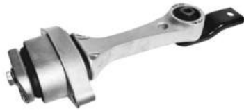
Código: 90052 Modelo: BORA - GOLF4 Nº Original: 1J0.199.851.AA Soporte tensor de motor