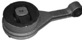
Código: 70145 Modelo: FIESTA Diesel Nº Original: 1018303 Soporte de motor central