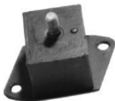
Código: 80116 Modelo: TRAFIC 1400 Nº Original: 7700697878 Soporte de motor