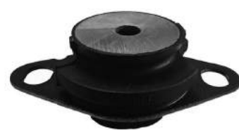
Código: 80194 Modelo: KANGOO-CLIO II Nº Original: 8200089697 Soporte de motor izquierdo