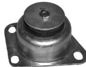
Código: 50160 Modelo: PALIO 1.8 Nº Original: 0046808873 Soporte de motor lado izquierdo