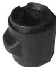
Código: 70195 Modelo: ECOSPORT 4X4 Nº Original: 2N15-5484-BA Buje barra estabilizadora Ø 18 mm