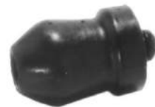
Código: 50090 Modelo: FIAT DUNA - UNO - 147 Nº Original: Tope de suspensión