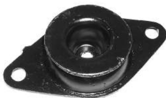
Código: 80158 Modelo: LAGUNA Nº Original: 7700818371 Soporte de motor lado derecho