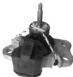
Código: 80175 NO HIDRAULICO Modelo: CLIO II Nº Original: 8200267625 Soporte motor no hidráulico lado derecho