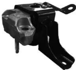
Código: 30022 Modelo: ETIOS 1.5 desde 2013.. Nº Original: 123050Y040 Soporte de motor derecho