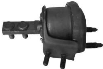
Código: 70171 NO HIDRAULICO Modelo: ESCORT Diesel Nº Original: 95AB-6038-CA Soporte motor lateral no hidráulico