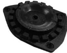
Código: 80195 Modelo: FLUENCE-MEGANE III Nº Original: 54320001R Soporte de amortiguador