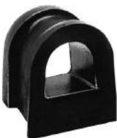
Código: 70031 Modelo: F. TAUNUS Nº Original: 71BB-3K576-AH Aislador caja de dirección