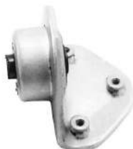
Código: 50113 Modelo: FIAT 147 - FIORINO Nº Original: 1481135 Soporte de motor lado izquierdo