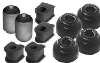
Código: 50187 Modelo: UNO FIRE Juego bujes suspensión delantera (10 piezas)