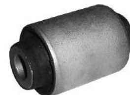
Código: 70155 Modelo: COURIER - FIESTA Nº Original: 96FB-3063-AB Buje parrilla delantera (central)