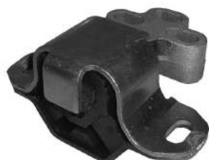
Código: 70141 Modelo: KA 99 en adelante Nº Original: XS-516038-AC Soporte de motor derecho