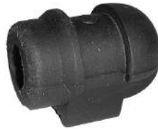
Código: 80050 Modelo: R19 - MEGANE Nº Original: 7700784170 Soporte punta barra estabilizadora