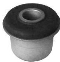
Código: 30008 Modelo: HILUX 4X4 SR5 Nº Original: 48632-260107 Buje parrilla superior ant. chico ø 18 mm