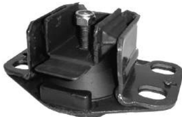
Código: 80146 NO HIDRAULICO Modelo: KANGOO Nº Original: 7700434320 Soporte de motor derecho (no hidráulico)