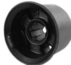
Código: 90058 Modelo: VENTO Nº Original: 1K0.407.183.B Buje parrilla delantera parte trasera (plástico)