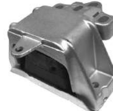
Código: 90048 Modelo: GOLF 1.6 - A4 - A8 Nº Original: 1J0.199.555.BD Soporte motor lado izquierdo