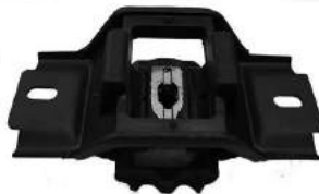
Código: 70223 Modelo: ECOSPORT 4X2 Y 4X4 Nº Original: 2S65-7M121-AB Soporte de caja de velocidades