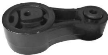
Código: 70191 Modelo: ECOSPORT Nº Original: 2N15-6P082-FA Soporte motor trasero