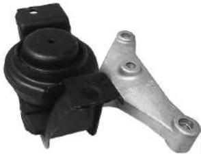
Código: 20001 HIDRAULICO Modelo: C3 Nafta Nº Original: 1839.F6 Soporte de motor hidráulico