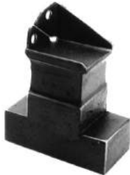
Código: 60041 Modelo: P. 504 - 505 Nº Original: 9991-043 Contrapeso de caja