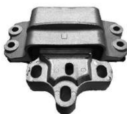
Código: 90072 Modelo: VENTO 2.0 Y 2.5 Nº Original: 1K0.199.555.Q Soporte de motor izquierdo