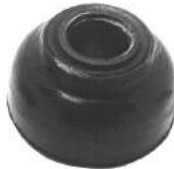
Código: 50095 D Modelo: FIAT DUNA Nº Original: 7558961 Buje tensor ø 14 mm