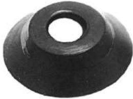
Código: 50081 Modelo: FIAT 600 Nº Original: 4028103 Espaciador manivela p/vidrio