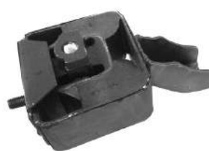
Código: 70040 Modelo: FIESTA Nafta Nº Original: 7229329 Soporte de motor derecho