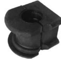
Código: 70186 Modelo: RANGER Nº Original: F87A-5484-AF Buje barra estabilizadora Ø 26 mm