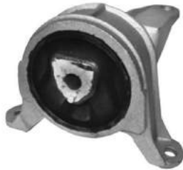
Código: 40064 Modelo: ASTRA 2.0 - ZAFIRA Nº Original: 90576049 Soporte de motor lado derecho