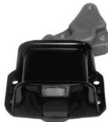
Código: 20008 HIDRAULICO Modelo: C4 2.0 Nafta Nº Original: 1839.94 Soporte de motor hidráulico