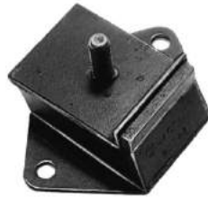
Código: 60043 Modelo: P. 504 Diesel Nº Original: 1807-280 Soporte de motor