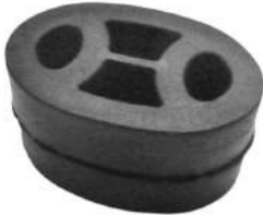
Código: 40066 Modelo: CORSA Nº Original: 90280491 Soporte caño de escape