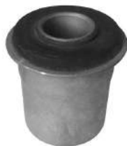
Código: 30007 Modelo: HILUX 4X4 SR5 Nº Original: 48635-26010 Buje parrilla superior