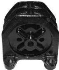
Código: 80159 Modelo: TRAFIC Diesel 99 en adelante Nº Original: 7700748646 Soporte de caja