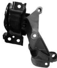
Código: 80207 HIDRAULICO Modelo: DUSTER Nº Original: 112101351R Soporte de motor derecho