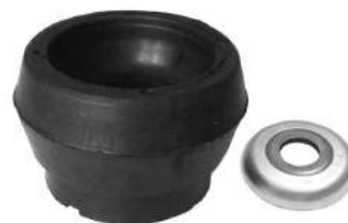
Código: 90051 Modelo: BORA - GOLF4 Nº Original: 1J0.412.331.C Soporte amortiguador con crapodina