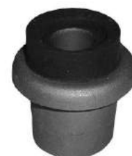
Código: 50163 Modelo: DUNA - FIORINO - UNO Nº Original: 7566848 Buje parrilla trasera (lado rueda - pestaña U)