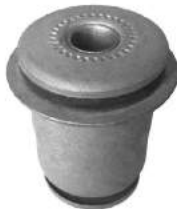
Código: 30016 Modelo: HILUX SW4 Nº Original: 48654-0K050 Buje parrilla del. Inferior parte anterior