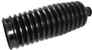
Código: 50144 Modelo: FIAT PALIO - SIENA Nº Original: Fuelle caja de dirección