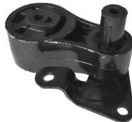
Código: 70189 Modelo: FIESTA - ECOSPORT MOTOR ROCAM Nº Original: 2S61-6P082-AB Soporte de motor trasero