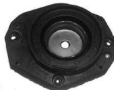
Código: 20032 Modelo: BERLINGO - XSARA - PICASSO Nº Original: 5038-240 Soporte amortiguador delantero