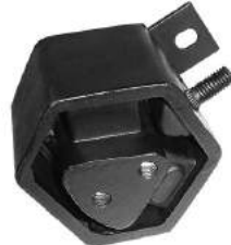
Código: 70117 Modelo: ESCORT Nº Original: 84AU6B049C Soporte de motor trasero izquierdo