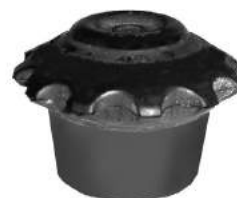
Código: 90014 Modelo: GACEL Nº Original: ZBA199339 Tope de motor delantero