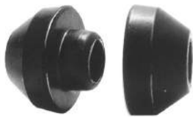
Código: 70002 - 70003 Modelo: F. FAIRLANE Nº Original: 82DR-3470-A Buje tensor (macho-hembra)