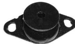
Código: 80152 Modelo: R19 Nº Original: 7700788318 Soporte delantero izquierdo