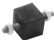
Código: 80119 Modelo: R. 12 Nº Original: 7702058583 Soporte comando caja