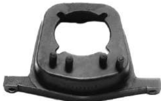
Código: 60024 Modelo: P. 504 - 404 Naftero Nº Original: 1843-260 Soporte de caja de velocidad