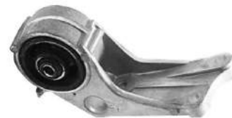
Código: 50115 Modelo: FIAT 128 Nº Original: 4218081 Soporte de motor