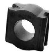
Código: 60011 Modelo: P. 504 2000 Nº Original: 5094-011 Buje barra estabilizadora ø grande