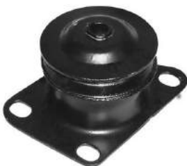
Código: 50161 Modelo: PALIO - SIENA AÑO 2001 en Adelante Nº Original: 51709049 Soporte de motor lado caja