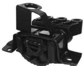
Código: 50183 Modelo: PUNTO 1.8 Nº Original: 51761602 Soporte motor lado derecho