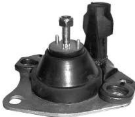
Código: 80139 HIDRAULICO Modelo: MEGANE Motor 2000 Nº Original: 7700832256 Soporte de motor derecho (hidráulico)