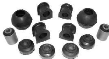
Código: 50145 Modelo: DUNA - UNO Juego de tren delantero (12 piezas)