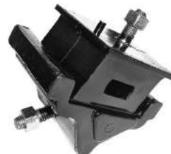
Código: 70134 Modelo: F100 Diesel MAXION Nº Original: 96TU6038AA Soporte de motor delantero