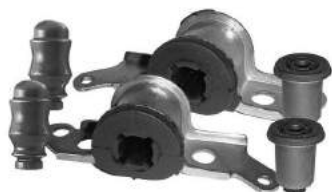
Código: 50185 Modelo: PALIO - SIENA Juego bujes dirección mecánica (6 piezas)