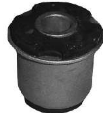
Código: 60083 Modelo: 405 Nº Original: 3523-400 Buje parrilla delantera (con pestaña)