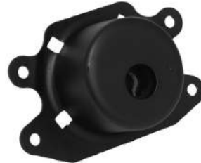
Código: 40046 HIDRAULICO Modelo: CORSA II - MERIVA Nº Original: 93302282 Soporte de motor hidráulico izquierdo