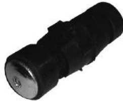
Código: 80166 Modelo: CLIO II - KANGOO Nº Original: 7700799404 Bieleta barra estabilizadora (punta)