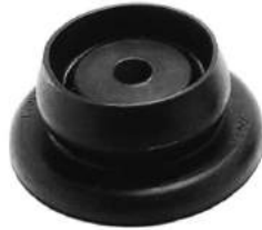
Código: 60046 Modelo: R. 405 Nº Original: 5037-250 Soporte de amortiguador