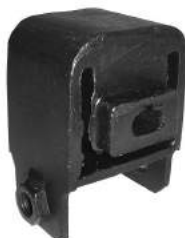
Código: 90017 Modelo: GACEL Nº Original: ZBA3991511 Soporte de caja de velocidades