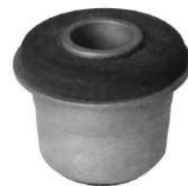
Código: 30009 Modelo: HILUX 4X4 SR5 Nº Original: 48632-260107 Buje parrilla superior ant. chico ø 20 mm