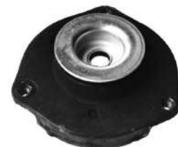
Código: 90056 Modelo: FOX - POLO 2002 - SURAN Nº Original: 6Q0.412.331.A Soporte amortiguador delantero