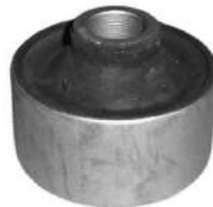
Código: 40035 Modelo: CHEVROLET VECTRA Nº Original: Buje parrilla inferior parte trasera (grande) Ø 61