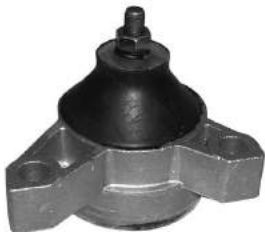
Código: 70150 NO HIDRAULICO Modelo: FOCUS Nº Original: 1104173 Soporte de motor izquierdo (no hidráulico)