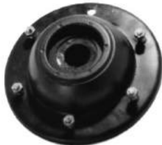
Código: 80118 Modelo: TRAFIC Nº Original: 7700734718 Soporte de amortiguador