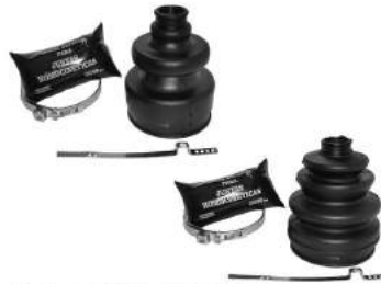
Código: 60058 - 60059 Modelo: 405 Fuelle (lado caja) Fuelle (lado rueda) con grasa y abrazaderas