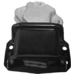
Código: 20031 HIDRAULICO Modelo: C4 PICASSO GRAND PICASSO 1.6 HDI Nº Original: 1807GF Soporte de motor hidráulico