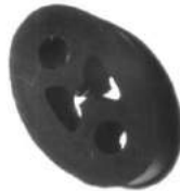
Código: 50138 Modelo: FIAT PALIO - SIENA - PALIO WEEKEND Nº Original: 7798284 Soporte de caño de escape