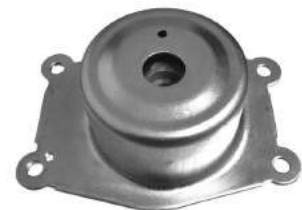
Código: 40044 HIDRAULICO Modelo: ASTRA - ZAFIRA 2.0 Nº Original: 90576062 Soporte de motor hidráulico izquierdo