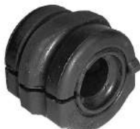
Código: 20020 Modelo: BERLINGO Nº Original: 5094-660 Soporte barra est. ø 19 mm