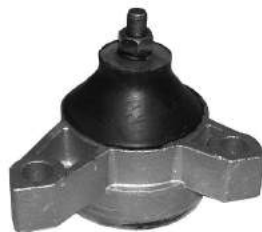
Código: 70176 HIDRAULICO Modelo: FOCUS Nº Original: 11.041.73 Soporte motor hidráulico lado