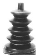
Código: 80010 Modelo: R. 12 Nº Original: 7700520909 Guardapolvo de palanca de cambios