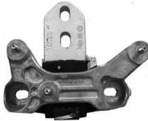
Código: 70232 Modelo: KA 2015.. Nº Original: E3B1-6F012-BF Soporte de motor derecho