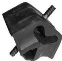
Código: 70123 Modelo: GALAXY Nº Original: 823199381 Soporte de motor delantero