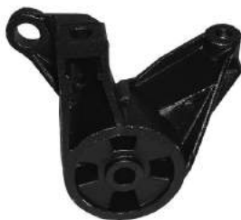
Código: 80162 Modelo: EXPRESS Diesel Nº Original: 7700770479 Soporte de motor lado izquierdo