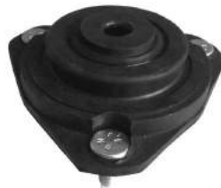
Código: 70192 Modelo: ECOSPORT Nº Original: 2S65-3K155-CB Soporte amortiguador