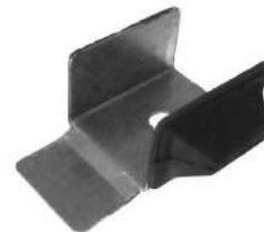
Código: 80169 Modelo: CLIO II - MEGANE Nº Original: 7700434370 Tope soporte hidráulico