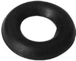
Código: 90066 Modelo: GOL Nº Original: 861.253.147 Soporte caño de escape