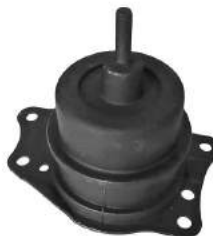
Código: 90042 HIDRAULICO Modelo: FOX - SURAN 1,6 Nº Original: 6Q0.199.167.J Soporte motor hidráulico izquierdo