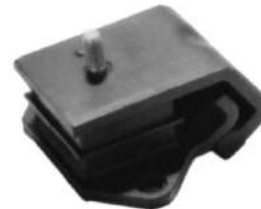
Código: 80109 Modelo: TRAFIC 2000 Nº Original: 7700745290 Soporte delantero de motor