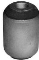
Código: 50165 Modelo: 128 - 147 - DUNA - UNO Nº Original: 1482311 Buje lado rótula oscilante ø 10 mm