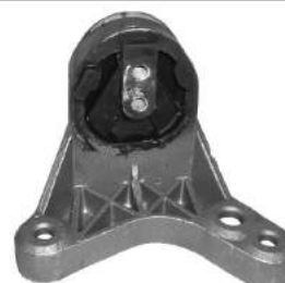
Código: 70140 Modelo: KA Nº Original: 97KB-6038-AD Soporte de motor derecho