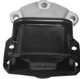
Código: 60094 HIDRAULICO Modelo: 308 3008 1.6 16V Nº Original: 1807GG Soporte de motor hidráulico