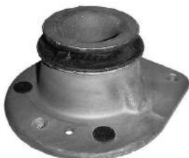
Código: 50149 Modelo: PALIO - SIENA Nº Original: 467606740 Soporte de amortiguador izquierdo