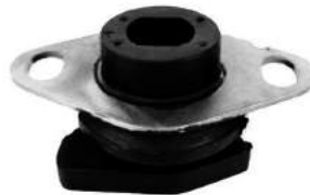
Código: 80202 Modelo: MEGANE II-SCENIC II K4M Nº Original: 7700427286 Soporte de motor izquierdo lado caja