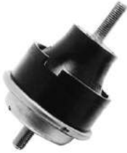
Código: 60045 HIDRAULICO Modelo: P. 405 Nº Original: 1844-420 Soporte de motor (hidráulico)