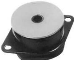
Código: 50105 Modelo: FIAT DUNA - UNO - WEEKEND 1.7 Nº Original: 7587675 Soporte de caja de velocidad