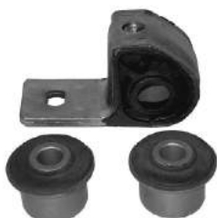
Código: 60073 Modelo: 306 - PARTNER Kit Reparación parrilla Ø 19.6 mm