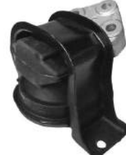
Código: 20003 HIDRAULICO Modelo: C3 Nafta Nº Original: 1839.F0 Soporte de motor hidráulico lado derecho