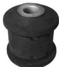
Código: 90059 Modelo: VENTO Nº Original: 1K0.407.182 Buje parrilla delantera parte central