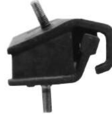
Código: 80122 Modelo: R. 19 - CLIO Nº Original: 7700801543 Soporte de motor izquierdo