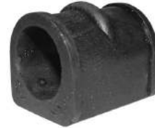
Código: 40055 Modelo: ASTRA - MERIVA 98 en adelante Nº Original: 90538865 Buje barra estabilizadora 17,5 mm