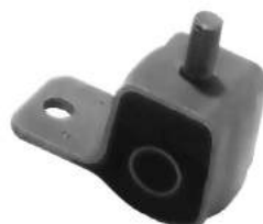
Código: 60055 Dorado Modelo: P. 405 Nº Original: 3523-540 Artic. brazo parilla delantero ø 18,1