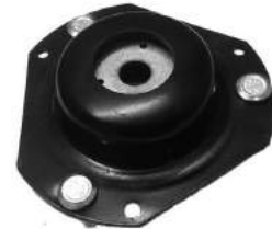
Código: 70209 Modelo: FIESTA KINECTIC Nº Original: 8V51-3K155-BA Soporte amortiguador delantero