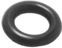
Código: 50073 D Modelo: FIAT DUNA - UNO Nº Original: 4387294 Soporte de caño de escape intermedio