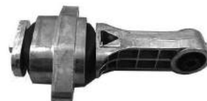
Código: 40083 Modelo: AVEO Nº Original: 96535410 Soporte de motor trasero