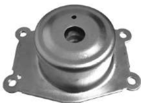
Código: 40045 NO HIDRAULICO Modelo: ASTRA - ZAFIRA 2.0 Nº Original: 90576062 Soporte de motor no hidráulico izquierdo