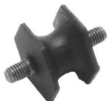
Código: 80102 Modelo: R. 12 Nº Original: 7702020566 Soporte caño de escape