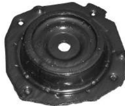
Código: 80160 Modelo: R21 Nº Original: 7700757691 Soporte de amortiguador