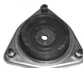
Código: 70137 Modelo: ESCORT 96 en adelante Nº Original: 95AB-3K155-AD Soporte de amortiguador