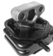
Código: 70193 Modelo: ECOSPORT 4X4 Nº Original: 2N15-6F012-LA Soporte motor del. derecho