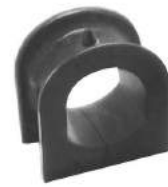
Código: 50123 Modelo: FIAT DUNA - UNO Nº Original: 7550774 Aislador de caja de dirección