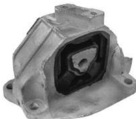
Código: 90067 Modelo: FOX - SURAN - GOL TREND Nº Original: 5U0.199.167.B Soporte de motor derecho