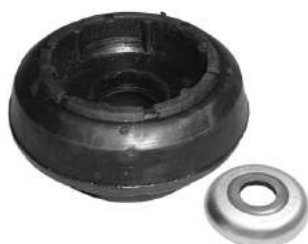
Código: 90025 Modelo: POLO Nº Original: 357412331 Soporte de amortiguador delantero