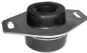
Código: 60069 Modelo: 306 Nº Original: 184436 Soporte de motor izquierdo