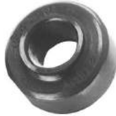
Código: 50122 Modelo: FIAT DUCATO Nº Original: Buje tensor