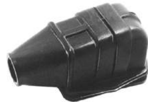
Código: 70017 Modelo: F. TAUNUS Nº Original: 74BR-7513-C Guardapolvo horquilla embrague