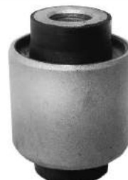
Código: 10015 Modelo: CIVIC Nº Original: 51392-SR3-014 Buje chico parrilla inferior delantera