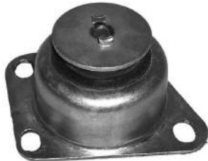
Código: 50169 Modelo: PALIO - SIENA 1.4 Nº Original: 51736530 Soporte de motor lado izquierdo