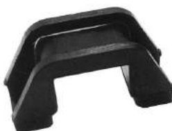
Código: 50044 Modelo: FIAT 600 Nº Original: 4007969 Soporte de elástico delantero