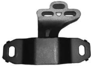
Código: 70205 Modelo: FIESTA 99/06 - KA 08.. Nº Original: 7S-556038-DB Soporte de caja adaptable