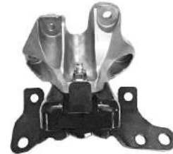
Código: 40075 Modelo: S10 MOTOR 2.4 L Nº Original: 52037204 Soporte de Motor Derecho