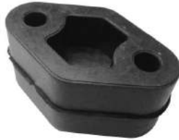
Código: 60091 Modelo: 405 - 307 - 407 - 406 Nº Original: Sin Código Soporte caño escape