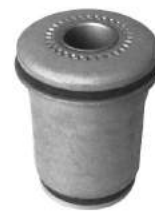
Código: 30006 Modelo: HILUX 4X4 SR5 Nº Original: 48061-26031 Buje parrilla inferior