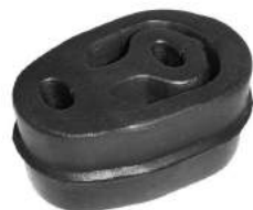
Código: 90019 Modelo: POINTER Nº Original: 542253147 Soporte de silenciador