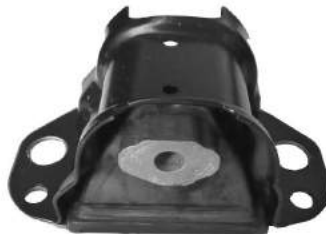
Código: 80170 HIDRAULICO Modelo: CLIO 1.2 - KANGOO Nº Original: 7700415087 Soporte motor hidráulico lado derecho