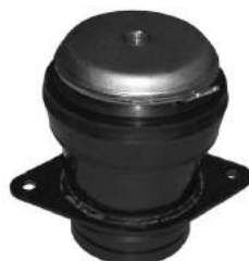
Código: 90022 Modelo: POLO - CADDY - Nafta / Diesel Nº Original: 1H0199262B Soporte de motor lado distribución