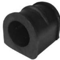
Código: 40057 Modelo: LUV ISUZU 4x4 Nº Original: 94459459 Buje barra estabilizadora ø 26 mm