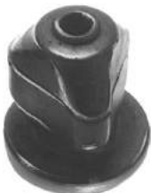
Código: 70018 Modelo: F. TAUNUS Nº Original: 74BR-5L021-D Buje aislador delantero