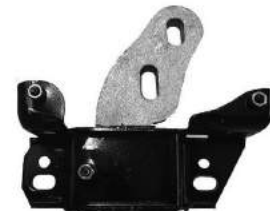
Código: 70230 Modelo: ECOSPORT KINECTIC 4x2 1.6.. Nº Original: CV21-7M121-AC Soporte de motor izquierdo