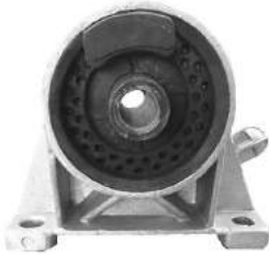
Código: 40074 Modelo: ASTRA - ZAFIRA - CORSA II Nº Original: 90538576 Soporte de Motor Lado Izquierdo