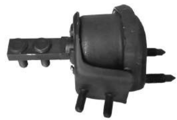
Código: 70170 HIDRAULICO Modelo: ESCORT Diesel Nº Original: 95AB-6038-CA Soporte motor lateral hidráulico