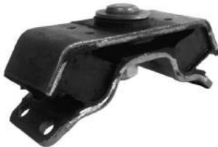
Código: 30004 Modelo: HILUX doble tracción Nº Original: 12371-54060 Soporte de caja de velocidades