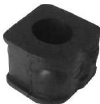
Código: 90065 Modelo: PASSAT Nº Original: 1H0.411.314 Buje barra estabilizadora juego der-izq. ø 22 mm