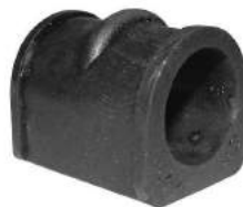
Código: 40054 Modelo: VECTRA 2002 en adelante Nº Original: 90538865 Buje barra estabilizadora ø 16 mm