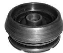
Código: 70037 Modelo: FIESTA - KA - COURIER 96 Nº Original: 96-FB-3K-155AB Soporte de amortiguador