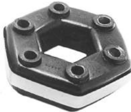
Código: 70007 Modelo: F. TAUNUS Nº Original: 7266-4684-BA Manchón de cardán