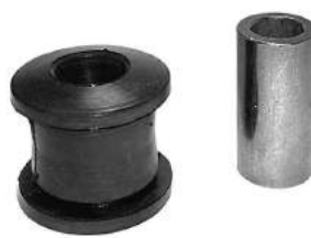
Código: 20026 Modelo: JUMPER Nº Original: 3521-650D Buje parrilla delantera