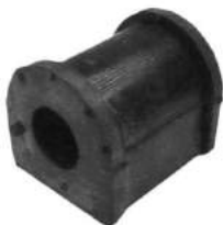
Código: 40053 Modelo: VECTRA 2002 en adelante Nº Original: 90468567 Buje barra estabilizadora ø 16 mm