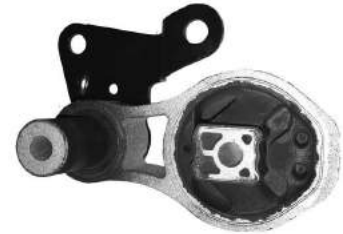
Código: 70207 Modelo: KA 08 AL 13 Nº Original: 2S61-6P082-AB Soporte de motor trasero