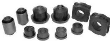
Código: 60060 Modelo: 504 Juego tren delantero (10 piezas)