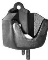
Código: 70107 Modelo: FALCON 7 Bancadas Nº Original: BAC9DZ6038A Soporte de motor delantero