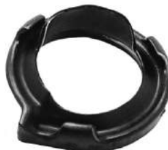
Código: 70033 Modelo: F. SIERRA Nº Original: Base apoyo espiral