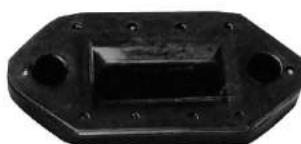
Código: 50022 Modelo: FIAT 600 Nº Original: 897704 Guarnición bisagra de capot