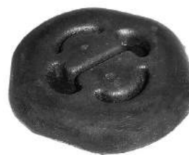
Código: 90018 Modelo: GOL - GOLF Nº Original: 307253147 Soporte de caño de escape