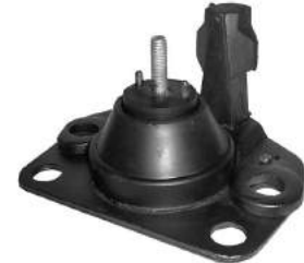
Código: 80138 NO HIDRAULICO Modelo: CLIO - EXPRESS Diesel Nº Original: 7700818994 Soporte de motor derecho (no hidráulico)