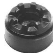
Código: 50101 Modelo: FIAT DUNA - UNO Nº Original: 7583185 Soporte de amortiguador delantero