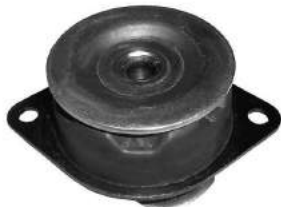
Código: 50158 Modelo: FIAT UNO 1.3 FIRE Nº Original: 50017753 Soporte de caja de velocidades