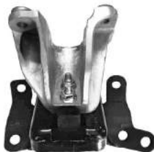
Código: 40076 Modelo: S10 MOTOR 2.4 L Nº Original: 52037203 Soporte de Motor Izquierdo