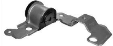
Código: 50143 Modelo: FIAT PALIO - SIENA (Full) Nº Original: 46454077 Soporte punta de parrilla izquierdo