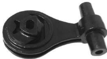
Código: 50171 Modelo: IDEA Nº Original: 51796653 Soporte trasero de motor