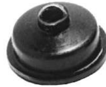
Código: 50088 Modelo: FIAT 600 Nº Original: 870050 Capuchón pedalera