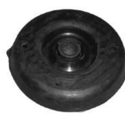
Código: 60078 Modelo: PEUGEOT 307 Nº Original: 5031770 Soporte de amortiguador delantero