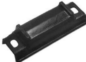
Código: 50086 Modelo: FIAT 147 - DUNA - UNO Nº Original: 4191524 Taco de apoyo elástico