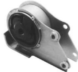
Código: 50125 Modelo: FIAT DUCATO Nº Original: Soporte de caja de velocidad