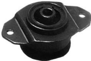
Código: 50108 Modelo: FIAT 147 Diesel Nº Original: 5983379 Soporte de motor lado izquierdo