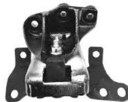
Código: 40077 Modelo: S10 MOTOR 2.5 L Nº Original: 94768486 Soporte de Motor Derecho