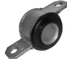
Código: 50141 Modelo: DUCATO Nº Original: 3521-650T Buje de parrilla delantera c/chapa