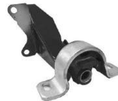
Código: 80199 Modelo: TWINGO Nº Original: 7700425709 Soporte de motor izquierdo completo