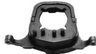
Código: 60040 Modelo: P. 504 - 505 Gama Diesel Nº Original: 1843631 Soporte de caja de velocidad