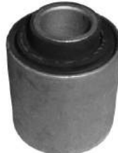
Código: 60082 Modelo: 504 - 505 Nº Original: 3523-160 Buje brazo oscilante delantero Ø 33 mm