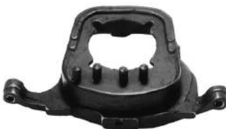
Código: 60038 Modelo: P. 505 - 504 5 Vel. Diesel Nº Original: 1843680 Soporte de caja de velocidad