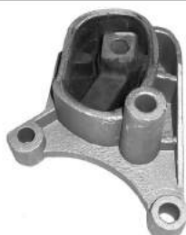
Código: 70139 Modelo: KA Nº Original: 97KB-68049-AH Soporte de motor lado caja