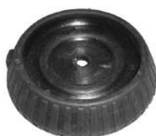
Código: 70142 Modelo: KA 97 en adelante Nº Original: 96FB-18198-AG Soporte de amortiguador trasero