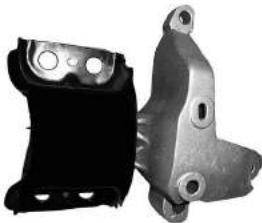
Código: 80203 HIDRAULICO Modelo: KANGOO K9K-CLIO II-SYMBOL II Nº Original: 8200410267 Soporte de motor derecho