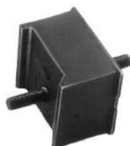
Código: 80013 Modelo: R. 18 1400 Nº Original: 7704000622 Soporte de motor (lado caja)