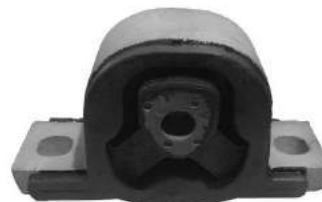
Código: 90068 Modelo: FOX - SURAN Nº Original: 5U0.199.555 Repuesto para soporte de motor izquierdo