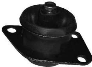
Código: 50155 Modelo: PALIO HLX - ELX Nº Original: 46762366 Soporte de motor lado caja