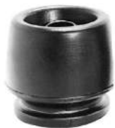
Código: 50061 Modelo: FIAT 128 Nº Original: 4177472 Protector de aceite c/retén