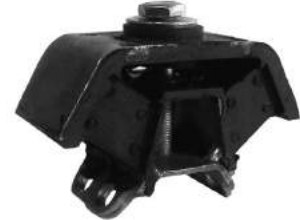
Código: 30003 Modelo: HILUX simple tracción Nº Original: 12371-34030 Soporte de caja de velocidades