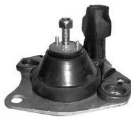
Código: 80140 NO HIDRAULICO Modelo: MEGANE Motor 2000 Nº Original: 4400832256 Soporte de motor derecho (no hidráulico)