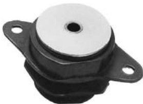
Código: 50111 Modelo: FIAT DUNA - WEEKEND 1.7 Nº Original: 7587673-7587674 Soporte de motor delantero derecho e izquierdo