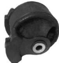
Código: 10009 Modelo: FIT Nº Original: 50805-SAA-J82/SLA-A81 Buje reparación soporte motor lado izq. automática