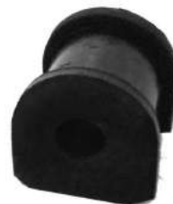
Código: 10018 Modelo: NEW CIVIC Nº Original: 52306-SNA-A001 Buje barra estabilizadora trasera ø 10 mm