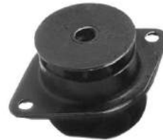
Código: 50109 Modelo: FIAT DUNA - UNO 1.3 Diesel Nº Original: 7563957 Soporte de caja de velocidad