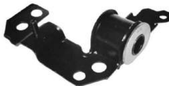
Código: 50172 Modelo: IDEA Nº Original: 51705473 Soporte parrilla delantero derecha