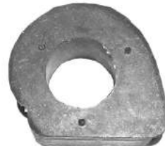
Código: 90035 Modelo: CARAT - PASSAT Nº Original: 305411327-2 Buje barra estabilizadora centro Ø 18 mm