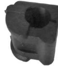
Código: 90062 Modelo: POLO - CADDY Nº Original: 1H0.411.314 Buje barra estabilizadora ø 20 mm