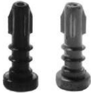
Código: 50072-50072S Modelo: FIAT 128 - 1600 - 147 - DUNA - UNO Nº Original: 410256 Tapón varilla nivel de aceite