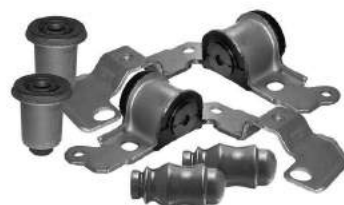
Código: 50184 Modelo: PALIO - SIENA Juego bujes dirección hidráulica (6 piezas)