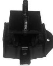
Código: 70213 Modelo: RANGER 4X2 2012.. Nº Original: AB39-7E373-HE Soporte de caja de velocidades