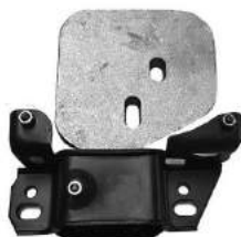
Código: 70231 Modelo: ECOSPORT KINECTIC 4x2 Nº Original: CV21-7M121-AD Soporte de motor izquierdo