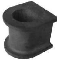
Código: 30014 Modelo: HILUX SW4 Nº Original: 48815-0K040 Buje barra estabilizadora delantera