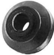
Código: 50031 Modelo: FIAT 600 Nº Original: 849128 Buje de amortiguador