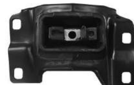
Código: 70226 Modelo: FOCUS 1.6 1.8 2.0 Nº Original: AV61-7N121-CC Soporte de motor izquierdo