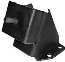
Código: 90001 Modelo: 1500 1.8 Nº Original: 3519205 Soporte de motor delantero