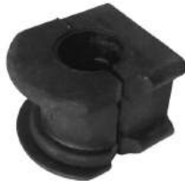
Código: 70187 Modelo: RANGER Nº Original: F87A-5484-A Buje barra estabilizadora Ø 29 mm