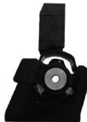
Código: 30020 Modelo: COROLLA desde 2009.. Nº Original: 123610D050 123610T270 123610T280 Soporte de motor trasero