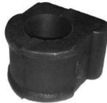
Código: 90053 Modelo: BORA - GOLF4 Nº Original: 1J0.411.314.C Buje barra estabilizadora delantera ø 21 mm