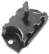
Código: 70008 Modelo: F. FALCON - FAIRLANE - F 100 Nº Original: C 6 DZ-6038-F Soporte de motor delantero