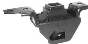
Código: 50126 D Modelo: FIAT PALIO - SIENA Nº Original: 46440550 Soporte de motor delantero