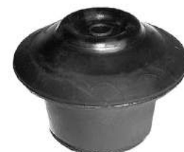
Código: 90015 Modelo: GOL - SAVERIO - SENDA Nº Original: 823199339 Tope de motor delantero