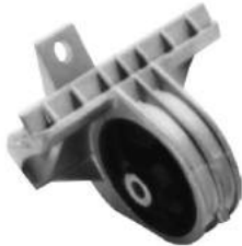
Código: 80120 Modelo: R. 19 - CLIO Nº Original: 7700804163 Soporte central de motor