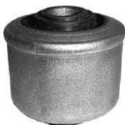
Código: 80052 Modelo: R19 Nº Original: 7700789478 Buje parrilla