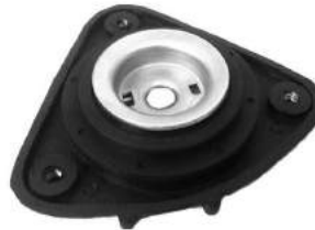
Código: 70208 Modelo: FOCUS II/III 08.. Nº Original: 3M51-3K155-DC Soporte amortiguador delantero