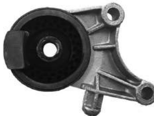
Código: 40062 Modelo: ASTRA 2.0 16V - ZAFIRA Nº Original: 90575190 Soporte motor delantero