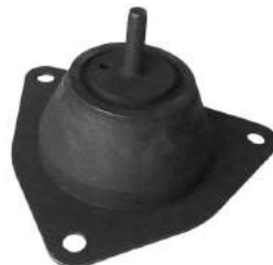
Código: 80172 HIDRAULICO Modelo: LAGUNA Nº Original: 7700414099 Soporte motor hidráulico lado derecho