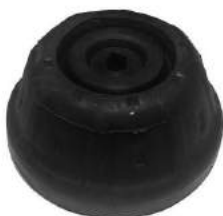
Código: 90069 Modelo: AMAROK Nº Original: 2H0.412.331 Soporte de amortiguador