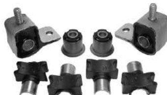
Código: 60063 Modelo: 405 (modelo viejo) Juego tren delantero (8 piezas)