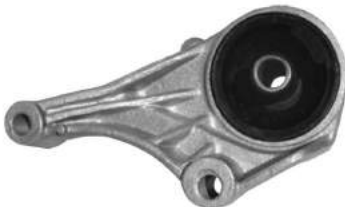
Código: 40059 Modelo: CORSA II - MERIVA Nº Original: 93302281 Soporte delantero izquierdo