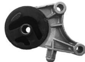
Código: 40063 Modelo: ASTRA 99 en adelante Nº Original: 90576048 Soporte motor delantero