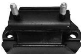
Código: 40079 Modelo: S10 MOTOR 4X2 Nº Original: 94771127 Soporte de Caja de Velocidades