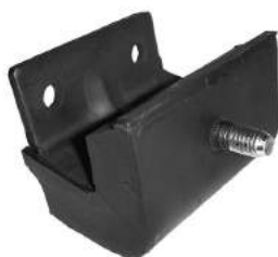
Código: 70110 Modelo: F100 8 Cilindros Nº Original: CIMM6038C Soporte de motor delantero