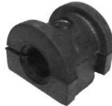
Código: 10005 Modelo: CIVIC Nº Original: Sin Código Buje barra estabilizadora delantero ø 18 mm