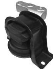
Código: 20006 NO HIDRAULICO Modelo: C3 Diesel Nº Original: 1807.W6 Soporte de motor no hidráulico lado derecho