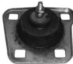
Código: 70147 NO HIDRAULICO Modelo: FIESTA Nafta Nº Original: 1024123 Soporte de motor delantero (no hidráulico)