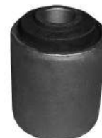
Código: 80164 Modelo: CLIO Nº Original: 7700799064I Buje parrilla (con cuello)