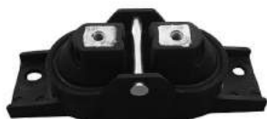
Código: 10019 Modelo: DODGE JOURNEY Nº Original: 05171071AC Soporte de motor derecho