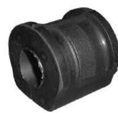
Código: 90039 Modelo: FOX - SPACEFOX - SURAN - GOL TREND Nº Original: 6Q0.411.314 Buje barra estabilizadora parte delantera