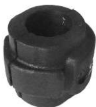
Código: 90063 Modelo: PASSAT 2002 en adelante Nº Original: 4D0.411.327-F Buje barra estabilizadora ø 27 mm