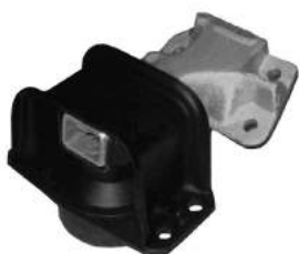
Código: 60076 HIDRAULICO Modelo: 307 - 1.6 16 V Nafta Nº Original: 183992 Soporte de motor (hidráulico)