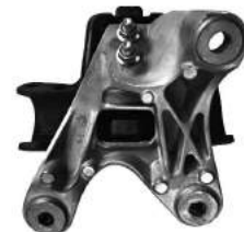
Código: 40081 Modelo: S10 Nº Original: 52037207 Soporte de motor izquierdo