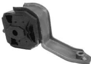
Código: 70039 Modelo: FIESTA Diesel Nº Original: 6185027 Soporte de motor izquierdo