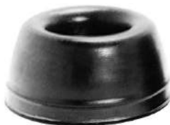
Código: 50060 Modelo: FIAT 600 Nº Original: 4084637 Protector de aceite c/retén