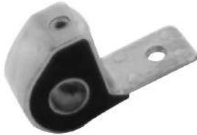
Código: 60057 Modelo: P. 306 Nº Original: 3523-541 Artic. brazo parrilla delantera ø 19,6