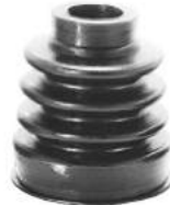
Código: 50114 Modelo: FIAT DUNA - UNO Nº Original: Fuelle de palier modelo c/abrazadera