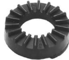
Código: 50104 Modelo: FIAT DUNA - UNO Nº Original: 5963374 Apoyo espiral