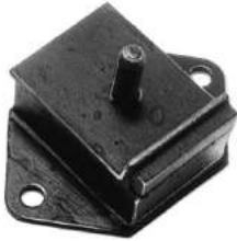
Código: 60013 Modelo: P. 504 Nº Original: 1807-250 Soporte de motor