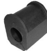
Código: 80051 Modelo: R19 - MEGANE Nº Original: 7700785788 Soporte intermedio barra estabilizadora