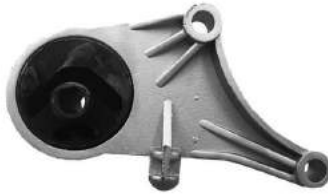
Código: 40065 Modelo: ASTRA - MERIVA - ZAFIRA Nº Original: 90575186 Soporte de motor