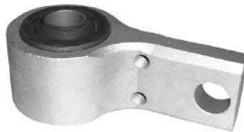
Código: 70160 Modelo: FIESTA - ECOSPORT año 2003 en adelante Nº Original: 2S65-3A262-AB Buje parrilla delantera parte trasera (soporte aluminio)