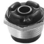
Código: 50129 Modelo: FIAT DUNA - UNO 94 en adelante Nº Original: 7635228 Soporte de amortiguador trasero