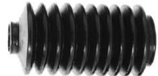
Código: 60015 Modelo: P. 504 - 404 Nº Original: 4065-030 Fuelle de caja de dirección (mecánica)