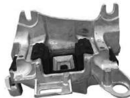
Código: 80196 Modelo: FLUENCE-MEGANE III CAJA MANUAL Nº Original: 112200014R Soporte de motor izquierdo