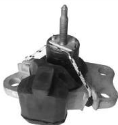
Código: 80174 HIDRAULICO Modelo: CLIO II Nº Original: 8200267625 Soporte motor hidráulico lado derecho Clío II