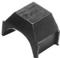
Código: 50082 Modelo: FIAT 1500 Nº Original: 4058656 Sostén de columna de dirección