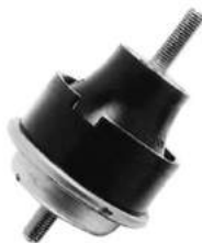
Código: 20014 HIDRAULICO Modelo: XSARA - XANTIA - BERLINGO Nº Original: 1843.73 Soporte de motor hidráulico