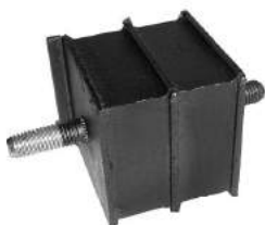
Código: 70133 Modelo: F100 - F150 Nº Original: FT71199201 Soporte de motor delantero