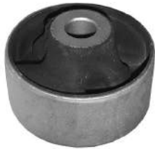
Código: 70156 Modelo: COURIER - FIESTA año 1997 / 1998 Nº Original: 98FB-3A262-AA Buje parrilla superior delantera parte trasera Ø 13 mm