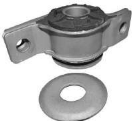
Código: 50178 Modelo: BRAVO - BRAVA - TIPO Nº Original: 46423822-A Buje brazo suspensión izquierdo ø 21 mm