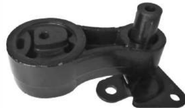
Código: 70190 Modelo: ECOSPORT 2.0 4X4 Nº Original: 2N15-6P082-CA Soporte motor trasero