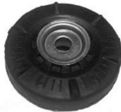
Código: 40073 Modelo: CRUZE Nº Original: 13505132 Soporte Amortiguador