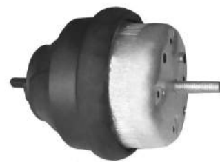
Código: 90041 NO HIDRAULICO Modelo: PASSAT - A4 Nº Original: 8D0.199.382.L Soporte motor no hidráulico ambos lados