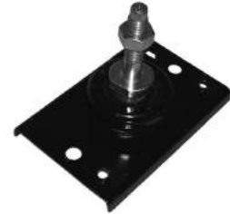
Código: 80155 Modelo: MASTER Nº Original: 8200199149 Soporte de motor izquierdo