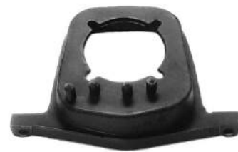
Código: 60023 Modelo: P. 504 - 404 Diesel Nº Original: 1843-261 Soporte de caja de velocidad