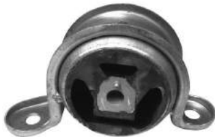
Código: 40043 Modelo: VECTRA año 94 Nº Original: 90495327 Soporte de motor