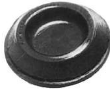
Código: 50098 Modelo: FIAT 600 Nº Original: 743598 Tapón de piso