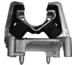
Código: 40087 Modelo: VECTRA Nº Original: 90495514 Soporte de motor trasero