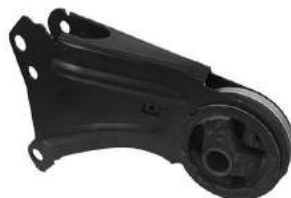
Código: 80201 Modelo: TWINGO Nº Original: 60015425711 Soporte de motor central trasero completo