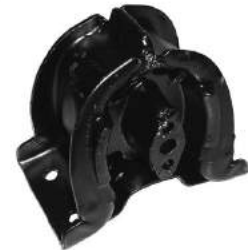
Código: 80151 Modelo: TRAFIC Nº Original: 7704001969 Soporte de caja de 4 velocidades