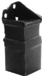
Código: 60027 Modelo: P. 404 - 504 - T4B Nº Original: 9991-039 Contrapeso de caja (corto)