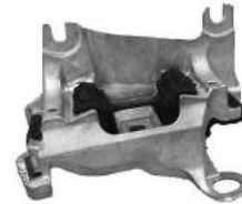
Código: 80197 Modelo: FLUENCE-MEGANE III CAJA AUTOMATICA Nº Original: 112206677R Soporte de motor izquierdo