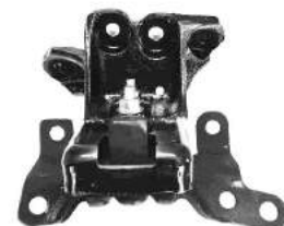
Código: 40078 Modelo: S10 MOTOR 2.5 L Nº Original: 94768485 Soporte de Motor Izquierdo