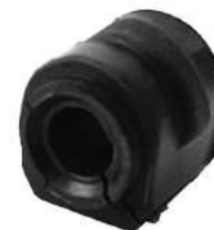
Código: 70197 Modelo: FOCUS Nº Original: 98AG-5484-DA Buje barra estabilizadora Ø 19 mm