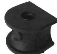
Código: 70200 Modelo: KA Nº Original: 547-411-327-A Buje barra estabilizadora central Ø 12 mm