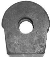
Código: 90028 Modelo: GACEL - GOL - SENDA - SAVEIRO Nº Original: 305411313-1 Buje barra estabilizadora punta Ø 15 mm