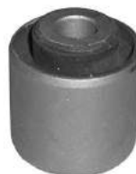
Código: 80163 Modelo: CLIO Nº Original: 7700799065D Buje parrilla (liso)