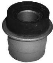
Código: 50164 Modelo: DUNA - FIORINO - UNO Nº Original: 7567085 Buje parrilla trasera (lado eje)