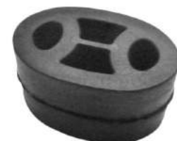
Código: 70203 Modelo: ECOSPORT Nº Original: Sin Código Soporte caño de escape