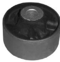
Código: 70157 Modelo: COURIER - FIESTA año 1998 Nº Original: 98FB-3A262-AA Buje parrilla superior delantera parte trasera Ø 12 mm