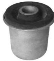
Código: 30017 Modelo: HILUX SW4 Nº Original: 48362-0K050 Buje parrilla del. superior