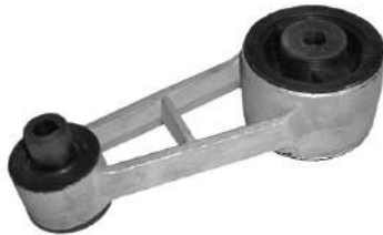
Código: 80136 Modelo: KANGOO 1.9 Diesel Nº Original: 7700426193 Soporte de motor lado caja