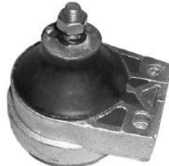
Código: 70148 NO HIDRAULICO Modelo: FOCUS Nº Original: 1072572 Soporte de motor derecho (no hidráulico)