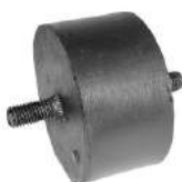
Código: 70105 Modelo: TAUNUS 2.0 y 2.3 Nº Original: 74BR6038A Soporte de motor delantero