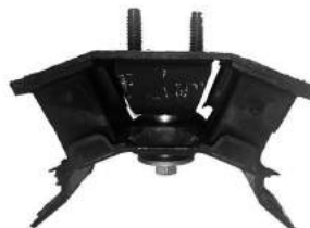
Código: 70210 Modelo: RANGER 4X4 2012.. Nº Original: AB39-7E373-KD Soporte de caja de velocidades