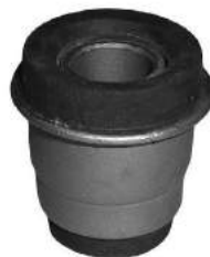
Código: 50162 Modelo: 147 - DUNA - UNO Nº Original: 4434652 Buje parrilla trasera (largo)