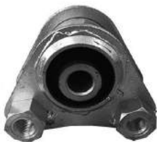
Código: 50197 Modelo: DUCATO Nº Original: 1310575080 Soporte superior de motor