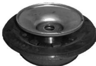
Código: 90020 Modelo: GOL - SAVERIO Nº Original: 377-412-329 Cazoleta delantera con rodamiento