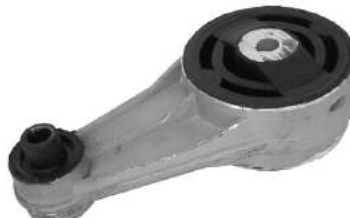
Código: 80143 Modelo: MEGANE - KANGOO Nafta Nº Original: 7700314800 Tensor lateral