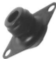
Código: 50132 Modelo: FIAT PALIO - SIENA Nº Original: 7799248 Soporte de caja de velocidades