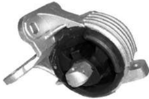
Código: 70204 Modelo: COURIER 2002.. Nº Original: 96FB7M121AJ Soporte de caja agujeros sin rosca