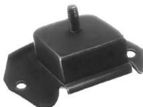
Código: 80034 Modelo: R. 12 Nº Original: 7700504590 Soporte lateral motor derecho e izquierdo