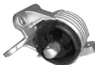
Código: 70143 Modelo: FIESTA Nº Original: 96FB-7M121-AJ Soporte de caja