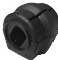
Código: 60088 Modelo: 307 Nº Original: 5094-87 Soporte barra estabilizadora ø 21 mm