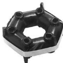
Código: 50043 Modelo: FIAT 125 - 1600 Nº Original: 4516801 Manchón de cardán