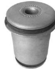
Código: 30015 Modelo: HILUX SW4 Nº Original: 48655-0K050 Buje parrilla del. Inferior parte posterior