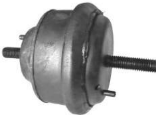
Código: 70174 HIDRAULICO Modelo: RANGER Nº Original: F47Z-6038-A Soporte motor hidráulico