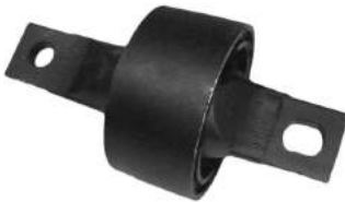
Código: 10004 Modelo: CIVIC CRV Nº Original: 52385-SR3-000 Buje brazo susp. trasera pantografo