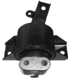
Código: 40069 Modelo: AVEO Nº Original: 96535499 Soporte de motor izquierdo