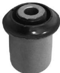
Código: 10014 Modelo: CIVIC Nº Original: 51392-S5A-004 Buje con ala parrilla inferior delantera