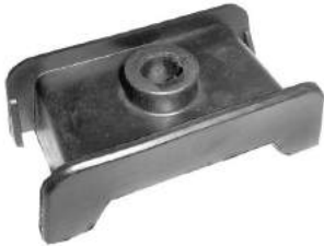
Código: 70116 Modelo: F100 Nº Original: C07PZ8100BOA Soporte de carrocería superior