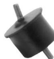
Código: 80104 Modelo: R. 18 2000 - FUEGO Nº Original: 7704000767 Soporte de motor derecho