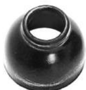
Código: 50074 Modelo: FIAT 600 Nº Original: 4094901 Capuchón de acople