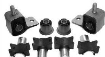
Código: 60064 Modelo: 405 (modelo nuevo) Juego tren delantero (8 piezas)