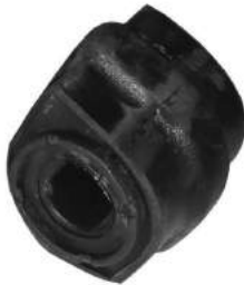
Código: 60093 Modelo: 206 Diesel Nº Original: 5094-800 Buje barra estabilizadora ø 18 mm