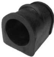
Código: 40056 Modelo: LUV ISUZU 4x2 Nº Original: 94459459 Buje barra estabilizadora ø 26 mm