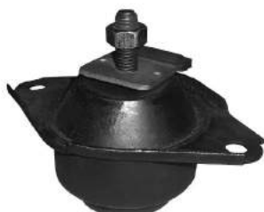
Código: 70041 HIDRAULICO Modelo: ESCORT Nº Original: 1012995 Soporte motor lado caja (hidráulico)