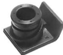
Código: 50127 Modelo: FIAT DUNA - UNO Nº Original: Tapón para llenado de aceite