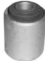
Código: 80167 Modelo: R21 Nº Original: 7700754515 Buje parrilla interior delantera (liso)