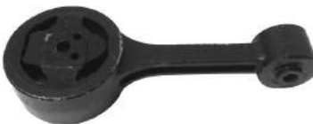
Código: 90057 Modelo: FOX Nº Original: 6Q0.199.851.AD Soporte motor trasero