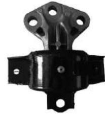
Código: 40088 Modelo: SONIC-COBALT-ONIX-SPIN-PRISMA II Nº Original: 95032353 Soporte de motor izquierdo