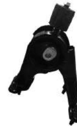
Código: 30021 Modelo: COROLLA desde 2009.. Nº Original: 123710D070 123710T100 123710T110 Soporte de motor trasero