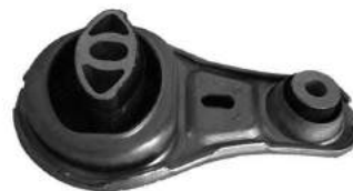
Código: 80208 Modelo: MASTER III Nº Original: 8200675206 Soporte de motor trasero central