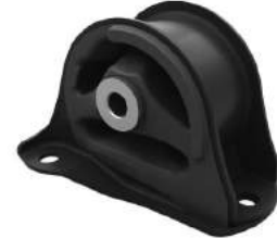
Código: 10003 Modelo: CIVIC CRV Nº Original: 50810-SR3-030 Soporte trasero de motor