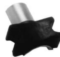
Código: 60053 Dorado Modelo: P. 405 Nº Original: 5094-530 Buje barra estabilizadora ø 20