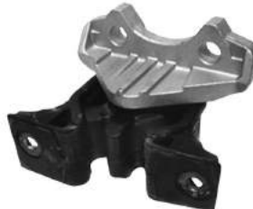
Código: 40060 Modelo: CORSA II - MERIVA Nº Original: 93302280 Soporte lado derecho