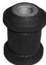
Código: 90038 Modelo: FOX - SURAN 2006 en adelante Nº Original: 6Q0.407.182A Buje parrilla delantera parte delantera