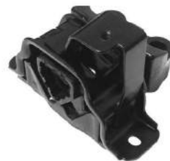
Código: 50182 Modelo: PUNTO 1.4 Nº Original: 51761607 Soporte motor lado izquierdo