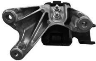
Código: 40082 Modelo: S10 MOTOR 3.6 L Nº Original: 52037207 Soporte de motor derecho