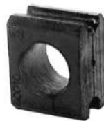
Código: 60010 Modelo: P. 504 1800 Nº Original: 5094-021 Buje barra estabilizadora ø grande