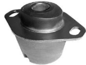
Código: 60068 Modelo: 206 - 106 Nº Original: 184451 Soporte de motor izquierdo