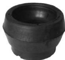
Código: 90050 Modelo: BORA - GOLF4 Nº Original: 1J0.412.331.C Soporte amortiguador