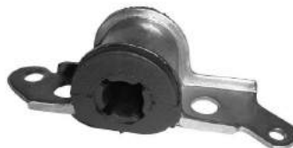
Código: 50147 Modelo: FIAT PALIO - SIENA (Base) Nº Original: 46450461 Soporte punta de parrilla izquierdo