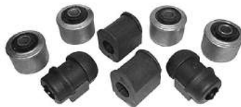
Código: 80054 Modelo: R19 Kit suspensión (8 piezas)