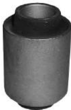
Código: 60081 Modelo: 504 - 505 Nº Original: 3523-120 Buje brazo oscilante Ø 29 mm