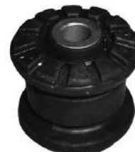
Código: 90027 Modelo: GOL - SAVEIRO - SENDA - GOLF - CARAT Nº Original: 811407181-A Buje parrilla delantera (ranurado)