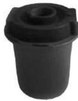
Código: 70182 Modelo: RANGER Nº Original: F67A-3069-AA Buje parrilla del. inferior parte delantera