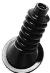
Código: 70015 Modelo: F. FALCON Nº Original: C9DT-7A533-A Guardapolvo varilla pedal embrague