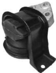
Código: 20004 NO HIDRAULICO Modelo: C3 Nafta Nº Original: 1839.F0 Soporte de motor no hidráulico lado derecho