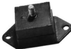
Código: 80117 Modelo: TRAFIC 2000 Nº Original: 770069879 Soporte de motor