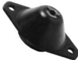
Código: 80108 Modelo: TRAFIC Nº Original: 7700702890 Soporte de caja de 5 velocidades