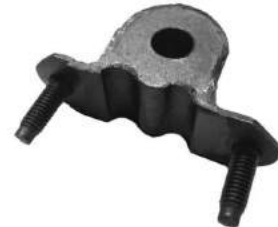
Código: 50166 Modelo: PALIO - SIENA Nº Original: 51744226 Buje barra estabilizadora