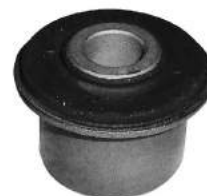
Código: 20015 Modelo: XSARA - XANTIA - BERLINGO Nº Original: 3523-401 Buje parrilla suspensión delantera