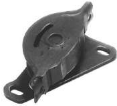
Código: 50056 Modelo: FIAT 147 Diesel Nº Original: 4471189 Soporte de motor (lado caja)