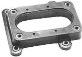
Código: 50130 Modelo: FIAT DUNA - UNO Nº Original: Soporte base de carburador