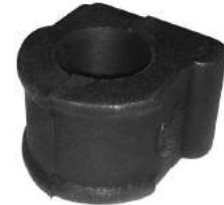
Código: 90054 Modelo: BORA - GOLF4 Nº Original: 1J0.411.314.C Buje barra estabilizadora delantera ø 23 mm