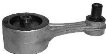
Código: 80130 Modelo: CLIO - 19 - EXPRESS Diesel Nº Original: 7700800522 Soporte de motor lado caja (recto 50 mm)