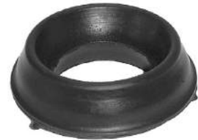
Código: 80135 Modelo: EXPRESS Nº Original: 7700757324 Cazoleta delantera (solo goma)