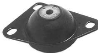
Código: 50131 Modelo: FIAT PALIO - SIENA Nº Original: 46444759 Soporte de motor