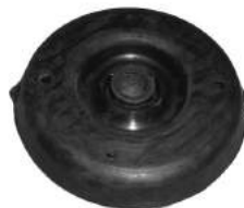
Código: 20011 Modelo: C4 Nº Original: 5031-770 Soporte amortiguador