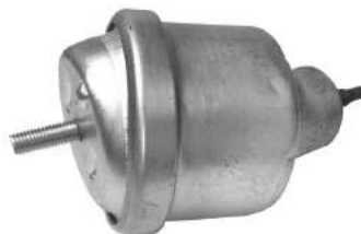
Código: 40038 NO HIDRAULICO Modelo: VECTRA Nº Original: 90497967 Soporte motor no hidráulico lado izq. cuello curvo