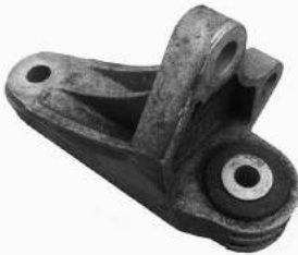
Código: 70227 Modelo: FOCUS III 2.0 Nº Original: BV61-6P093-HA Soporte de caja de velocidades