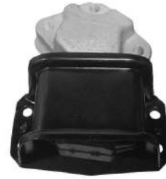
Código: 60095 HIDRAULICO Modelo: 308 3008 1.6 HDI Nº Original: 1807GF Soporte de motor hidráulico