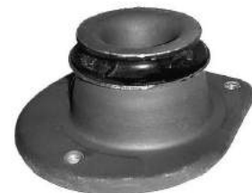
Código: 50148 Modelo: PALIO - SIENA Nº Original: 467606730 Soporte de amortiguador derecho