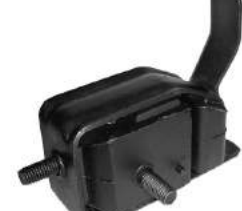
Código: 70121 Modelo: ESCORT 1.8 Nº Original: 90AU6068BA Soporte de motor trasero derecho