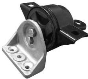
Código: 40068 Modelo: AVEO Nº Original: 96535431 Soporte de motor derecho