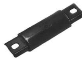
Código: 50049 Modelo: FIAT 147 - DUNA - UNO - REGATTA Nº Original: 4331717 Soporte de elástico