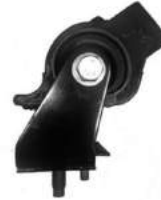
Código: 70214 Modelo: RANGER 4X2 2012.. Nº Original: AB39-6B032-EF Soporte de motor izquierdo