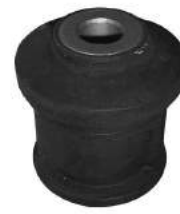
Código: 70158 Modelo: FIESTA - ECOSPORT año 2003 en adelante Nº Original: 2S65-3063-AA Buje parrilla delantera parte central