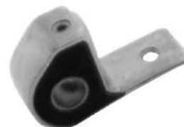
Código: 60056 Plateado Modelo: P. 306 Nº Original: 3523-542 Artic. brazo parrilla delantero ø 18,7