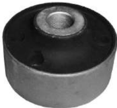
Código: 90031 Modelo: BORA - GOLF AÑO 1999 EN ADELANTE - NEW BEETLE Nº Original: 191407181-D Buje parrilla inferior delantera parte trasera Ø 13 mm