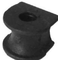
Código: 70199 Modelo: FIESTA - ESCORT - COURIER Nº Original: 94AB-5484-AA Buje barra estabilizadora Ø 16 mm