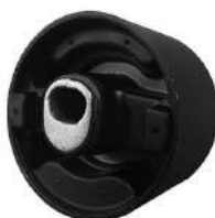
Código: 10020 Modelo: DODGE JOURNEY Nº Original: 05171079AC/80AC Buje reparación soporte motor trasero