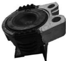
Código: 70217 HIDRAULICO Modelo: FOCUS II/III Nº Original: 3M51-6F012-CJ/AG Repuestos para soporte de motor hidraulico