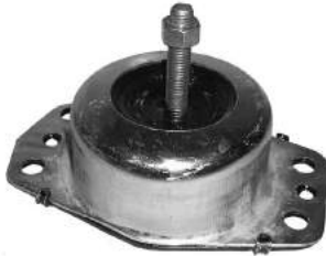
Código: 80156 Modelo: MASTER Nº Original: 8200022595 Soporte de motor derecho