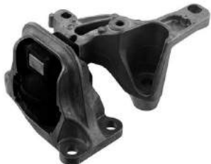
Código: 80204 HIDRAULICO Modelo: FLUENCE K4M-MEGANE III-SCENIC III Nº Original: 112100014R Soporte de motor derecho