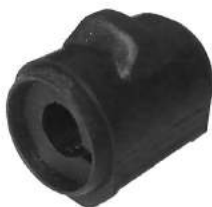
Código: 70194 Modelo: ECOSPORT 4X2 Nº Original: 98AG-5484-DA Buje barra estabilizadora Ø16 mm