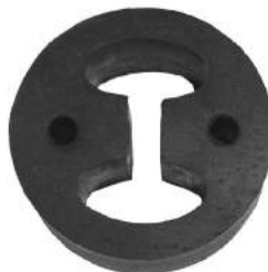
Código: 70202 Modelo: TRANSIT Nº Original: Sin Código Soporte caño de escape