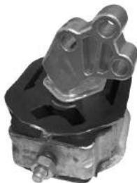
Código: 70188 Modelo: FIESTA - ECOSPORT 1.6 - ROCAM Nº Original: 2S65-6F012-LB Soporte de motor derecho