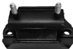
Código: 40080 Modelo: S10 MOTOR 4X4 Nº Original: 94771127 Soporte de Caja de Velocidades