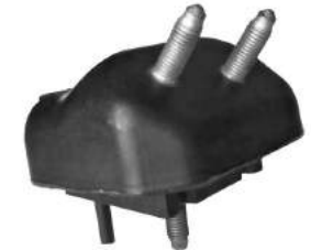
Código: 70180 Modelo: RANGER Diesel Nº Original: YL54-6038-AA Soporte de motor derecho