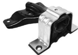
Código: 80190 Modelo: LOGAN - SANDERO 1,6 Nº Original: 8200644289 Soporte de motor derecho