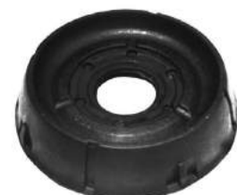
Código: 80144 Modelo: KANGOO - CLIO FASE II Nº Original: 7700829529 Cazoleta delantera