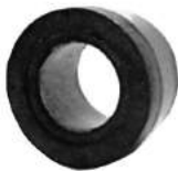
Código: 60029 Modelo: P. 505 Nº Original: 3523-100 Buje de parrilla cónico