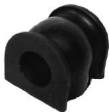
Código: 10013 Modelo: FIT Nº Original: 51306-SAA-E02 Buje central barra estabilizadora delantera