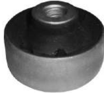
Código: 40034 Modelo: CHEVROLET CORSA II 2000 - MERIVA Nº Original: 93390600 Buje parrilla delantera parte trasera