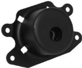
Código: 40047 NO HIDRAULICO Modelo: CORSA II - MERIVA Nº Original: 93302282 Soporte de motor no hidráulico izquierdo