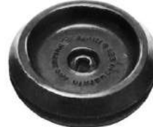
Código: 50099 Modelo: FIAT 600 Nº Original: 4079160 Pasa cable