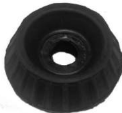
Código: 40072 Modelo: AVEO G3 Nº Original: 95015324 Soporte Amortiguador