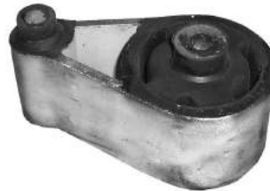
Código: 80157 Modelo: MASTER Nº Original: 7700308756 Soporte de motor trasero central