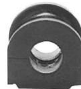
Código: 50052 R Modelo: FIAT REGATTA Nº Original: Buje barra estabilizadora \varnothing 16 mm