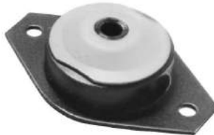
Código: 50100 Modelo: FIAT DUNA - UNO Diesel y Naftero Nº Original: 7563985 Soporte de motor