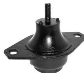
Código: 80132 HIDRAULICO Modelo: 19 Diesel Nº Original: 7700802927 Soporte de motor delantero derecho (hidráulico)