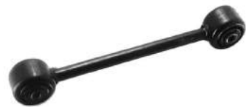
Código: 50037 Modelo: FIAT 128 Nº Original: 94000562 Bieleta de anclaje motor 1100