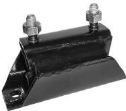
Código: 70135 Modelo: RANGER con caja MAZDA (1988 al '97) Nº Original: F57Z-6068-C Soporte de caja