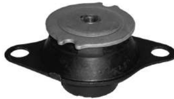
Código: 50153 Modelo: PALIO 1.3 MPI FIRE FASE 2 Nº Original: 46523938 Soporte de motor lado caja