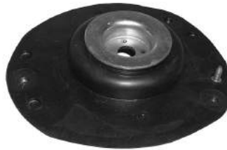
Código: 60080 I Modelo: PEUGEOT 206 Nº Original: 5038-360 Cazoleta de amortiguador izquierdo