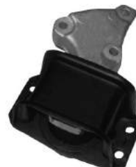
Código: 60075 HIDRAULICO Modelo: 307 - 2.0 HDI Diesel Nº Original: 183993 Soporte de motor (hidráulico)