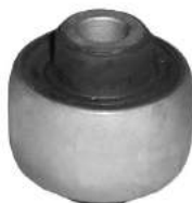
Código: 70153 Modelo: ESCORT - FIESTA - KA - ORION Nº Original: 547407181 Buje parrilla delantera parte delantera (barrilito)