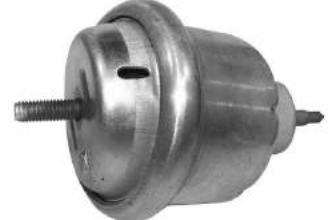
Código: 40042 NO HIDRAULICO Modelo: VECTRA caja automática Nº Original: 90498423 Soporte motor no hidráulico lado izq. cuello curvo