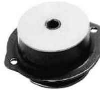
Código: 50110 Modelo: FIAT 147 Diesel Nº Original: 7563957 Soporte de motor lado derecho