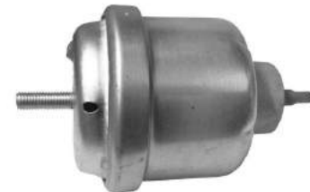
Código: 40039 HIDRAULICO Modelo: VECTRA Nº Original: 90495447 Soporte motor hidráulico lado der. cuello recto