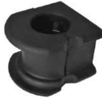
Código: 70185 Modelo: RANGER Nº Original: F87-5484-CG Buje barra estabilizadora Ø 31 mm