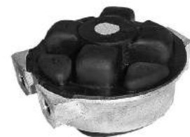
Código: 90009 Modelo: GOL - GACEL - SAVERIO - SENDA Nº Original: 3033991131 Soporte de caja de 5 velocidades