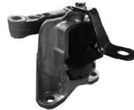
Código: 70233 Modelo: KA 2015.. Nº Original: E3B1-7M121-AD E3B1-7M121-CA Soporte de motor izquierdo