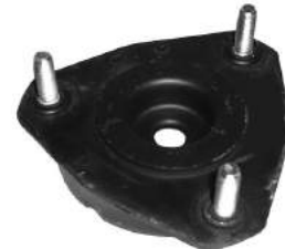
Código: 70151 Modelo: FOCUS Nº Original: 98AG-3K155-AF Cazoleta amortiguador