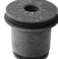
Código: 70183 Modelo: RANGER Nº Original: 2L54-3084-BA Buje parrilla del. superior