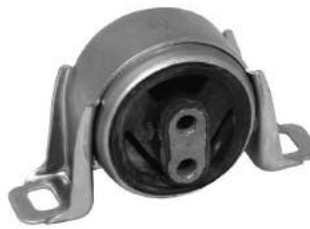
Código: 70172 Modelo: ESCORT Nº Original: 94AB-6B032-AB Soporte motor derecho