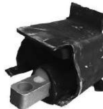
Código: 90070 Modelo: FOX-SURAN-VOYAGE-GOLTREND Nº Original: 6Q0.199.555.AD Repuesto para soporte de motor izquierdo