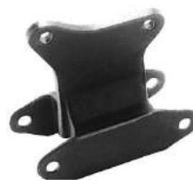
Código: 50047 Modelo: FIAT 125 - 1500 - 1600 Nº Original: 4060117 Soporte de motor lado caja