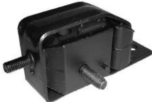
Código: 70119 Modelo: ESCORT 1.8 XR3 Nº Original: 90AU6038AA Soporte de motor trasero derecho