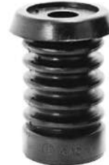
Código: 60047 Modelo: P. 405 Nº Original: 5033-270 Tope soporte de amortiguador