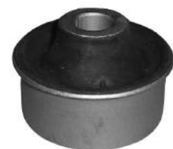
Código: 60086 Modelo: 206 - 307 Nº Original: 3523-770 Buje parrilla suspensión delantera (punta c/pestaña)