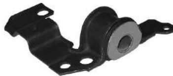
Código: 50156 Modelo: PALIO - SIENA FIRE Nº Original: 467485780 Soporte punta parrilla derecho