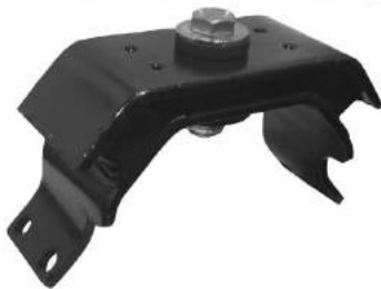
Código: 30019 Modelo: HILUX doble tracción 2005 en adelante Nº Original: 12371-0L090 Soporte de caja de velocidades