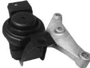
Código: 20002 NO HIDRAULICO Modelo: C3 Nafta Nº Original: 1839.F6 Soporte de motor no hidráulico