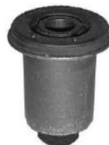
Código: 50150 Modelo: PALIO Nº Original: 46421522 Buje silent block suspensión