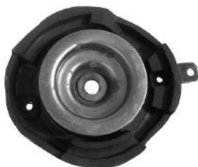
Código: 80150 Modelo: R19 - CLIO - MEGANE Nº Original: 770224432 Soporte de amortiguador