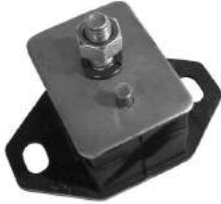
Código: 30001 Modelo: HILUX 2.4 y 2.8 Diesel Nº Original: 12361-54111 Soporte de motor