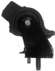
Código: 70215 Modelo: RANGER 4X2 2012.. Nº Original: AB39-6038-EF Soporte de motor derecho