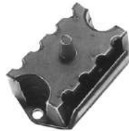
Código: 70010 Modelo: F 100 Diesel - F 350 c/motor Perkins Nº Original: BAD0DZ-6038-A Soporte de motor delantero