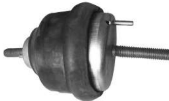
Código: 70162 NO HIDRAULICO Modelo: TRANSIT Nº Original: 95BVB-6B032-BA Soporte motor no hidráulico lado izquierdo