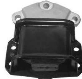
Código: 20030 HIDRAULICO Modelo: C4 1.6 Nº Original: 1807GG Soporte de motor hidráulico