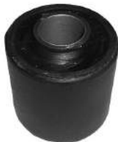
Código: 70159 Modelo: FIESTA - ECOSPORT año 2003 en adelante Nº Original: 2S65-3A262-AB Buje parrilla delantera parte trasera