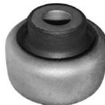
Código: 60085 Modelo: 206 Nº Original: 3523-790 Buje parrilla suspensión delantera (centro)