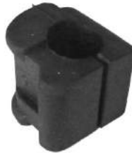
Código: 90061 Modelo: POLO - CADDY Nº Original: 1H0.411.314 Buje barra estabilizadora ø 18 mm