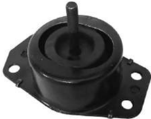
Código: 80188 Modelo: MASTER II/III Nº Original: 8200022596 Soporte de motor derecho