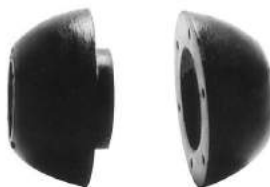
Código: 50026 Modelo: FIAT 125 - 1500 - 1600 Nº Original: 4125492 Buje tensor de dirección (juego)