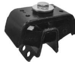
Código: 30018 Modelo: HILUX simple tracción 2005 en adelante Nº Original: 12371-0L070 Soporte de caja de velocidades