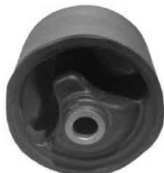
Código: 10017 Modelo: CIVIC 94/95 Nº Original: 50820-SR3-003 Buje reparación soporte izquierdo