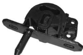
Código: 70138 Modelo: KA Nº Original: 97KB-68032-AE Soporte de motor lado izquierdo