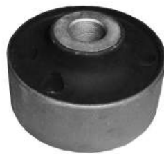
Código: 90032 Modelo: BORA - GOLF - NEW BEETLE Nº Original: 1J0.407.181 Buje parrilla inferior delantera parte trasera Ø 12 mm