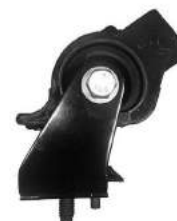
Código: 70211 Modelo: RANGER 4X4 2012.. Nº Original: AB39-6B032-EF Soporte de motor izquierdo