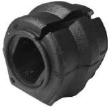
Código: 60090 Modelo: 307 Nº Original: 5094-89 Soporte barra estabilizadora ø 23 mm