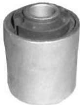
Código: 80168 Modelo: R21 Nº Original: 7700777276 Buje parrilla (estampado)