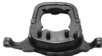
Código: 60039 Modelo: P. 504 - 505 Gama Naftero Nº Original: 1843621 Soporte de caja de velocidad