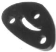
Código: 50137 Modelo: FIAT PALIO Nº Original: 46461540 Soporte de caño de escape