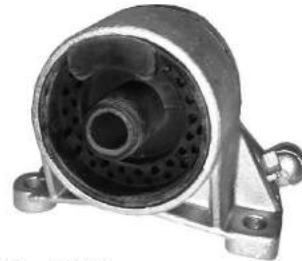
Código: 40067 Modelo: ASTRA - ZAFIRA Nº Original: 90575192 Soporte delantero frontal