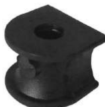
Código: 70201 Modelo: KA Nº Original: 547-411-327-A Buje barra estabilizadora central Ø 14 mm