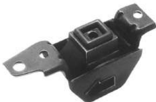
Código: 50126 Modelo: FIAT PALIO - SIENA Naftero Nº Original: 46439600 Soporte de motor delantero