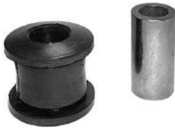
Código: 50118 Modelo: DUCATO Nº Original: 3521-650D Buje de parrilla delantero