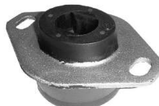
Código: 20024 Modelo: XSARA - XANTIA - BERLINGO Nº Original: 1843-950 Soporte de motor izquierdo