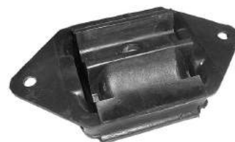
Código: 70108 Modelo: TAUNUS 2.0 y 2.3 Nº Original: 74BR6068A Soporte de caja